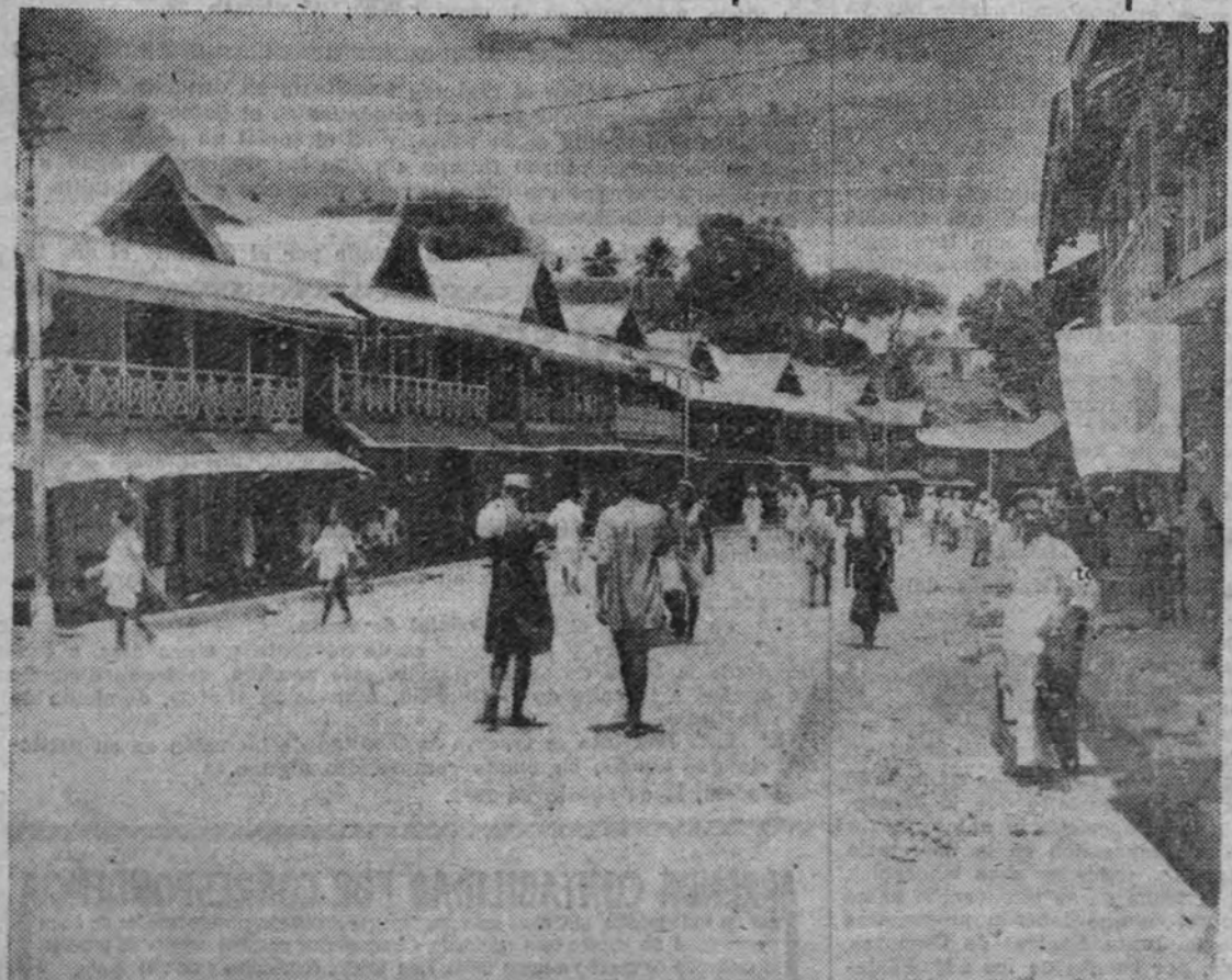
Aspecto de una calle de una población de las islas Andaman, en plena normalidad, después de la ocupación por las fuerzas japonesas.