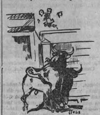
La salida del sexto novillo