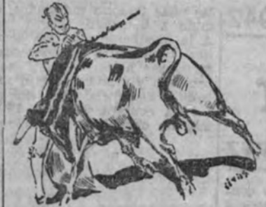
Bombita en la estocada al último toro

Ortega y Belmonte cortaron orejas y rabos en Gijón