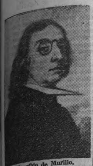
El Quevedo de Murillo.