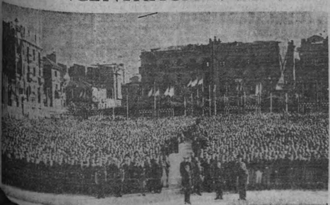
La Falange escucha la voz del Caudillo