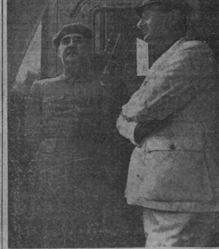
El Jefe del Estado y el Secretario General del Partido se dirigen a Vigo.