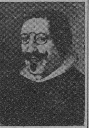
El Quevedo de Velázquez (?).