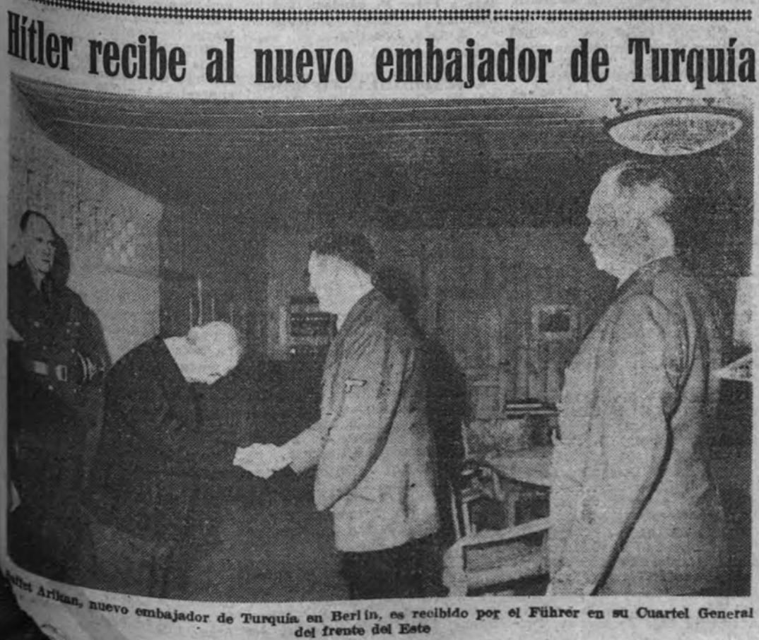
Arifian, nuevo embajador de Turquía en Berlín, es recibido por el Führer en su Cuartel General del frente del Este