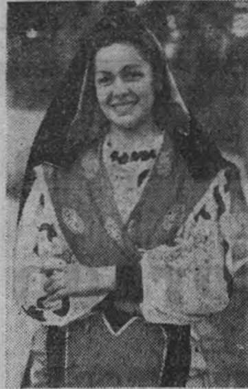
Esta flecha azul, sorprendida por nuestro fotógrafo, muestra toda la simpatía de nuestras camaradas y la bella policromía del típico español que la Sección Femenina lleva para que sea admirado en Alemania e Italia.

Treinta y dos camaradas de Salamanca, Pontevedra y Lérida van invitadas por las Juventudes Hitlerianas, y cincuenta flechas azules representarán a nuestras provincias en Italia Ayer llegaron a Madrid 32 camaradas de la provincia de Salamanca, Pontevedra y Lérida que, integrando un grupo folclórico, saldrán el próximo día 4 de septiembre para Alemania, invitadas por las Juventudes Hitlerianas. Visitarán diversos hospitales alemanes, en los que interpretarán folclore y cantos españoles vistiendo los trajes típicos de sus provincias respectivas, todos auténticos, antiguos y de gran valor. Representarán también el romance escandinavo "La condesa Rosalinda". Con este viaje, la Sección Femenina de la Falange llevará a diversos rincones alemanes unas manifestaciones de nuestro espléndido folclore.