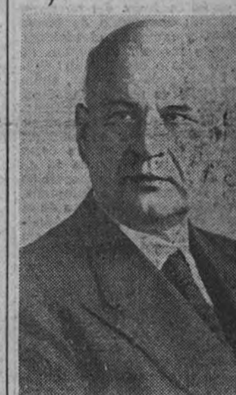
El doctor Thierack, recientemente nombrado por el Führer ministro de Justicia del Reich