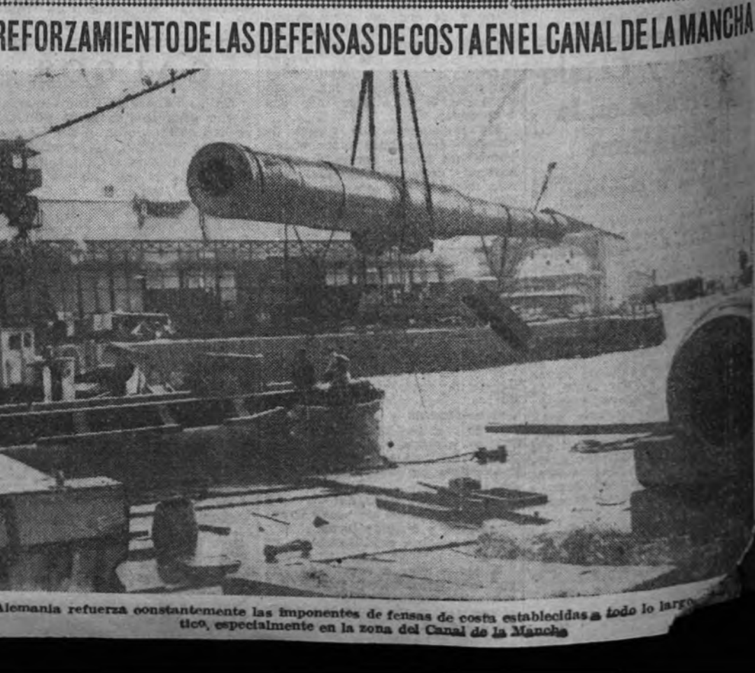
Alemania refuerza constantemente las imponentes defensas de costa establecidas a todo lo largo del Canal de la Mancha, especialmente en la zona del Canal de la Mancha.

Son pocas las novedades de importancia de este fin de semana. Como noticia de interés merece destacarse la afirmación hecha en París de que son muchos más los judíos detenidos ayer que los que habíamos creído en el primer momento. Parece que su cifra alcanza a diez mil. Internados en campos de concentración, se anuncia al primer proyecto de convertir la Costa Azul en la Nueva Jerusalén.