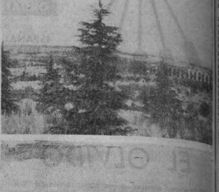
La visión terrible del Parque del Oeste—ornato y pulmón del Madrid moderno de antes—también presente no sólo los madrileños, sino casi todos los españoles. Aquello era algo peor que un campo abandonado, con las entrañas removidas por grandes barrancas: era un campo sembrado de bombas, minas y morteros sin explotar. Por eso la para de todos ante la visión de aquello, antes tan hermoso, era penosísima, y la mayoría creía que no volveríamos a ver más un parque en aquella zona de Madrid.

Está ya cubierto de césped la mitad del Parque y este año quedará sembrado todo él