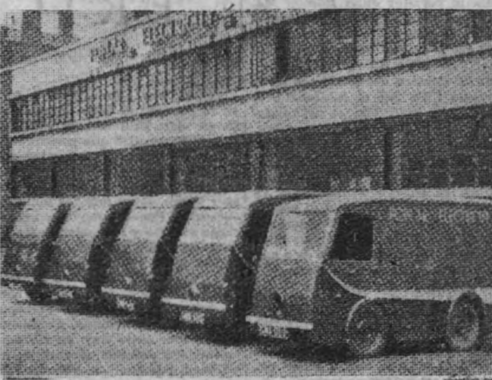
Grupo de camiones movidos por energía eléctrica

Los grandes industriales y los técnicos franceses, alemanes y americanos, establecieron más recientemente el beneficio innegable de este sistema de tracción, y lo establecieron en grandes circuitos urbanos. Ciertamente, el camión eléctrico no puede emplearse en grandes convoyes de camión, a largas distancias. Tiene la dificultad para ello de necesitar un cambio de acumuladores cargados, que habrían de hacer indispensable estaciones de aprovisionamiento que complicarían gravemente el problema. Pero en las ciudades el camión eléctrico ofrece enormes ventajas sobre el otro tipo de motor de explosión. Así lo ha entendido incluso un país como los Estados Unidos, donde el precio de la gasolina es sumamente barato. De