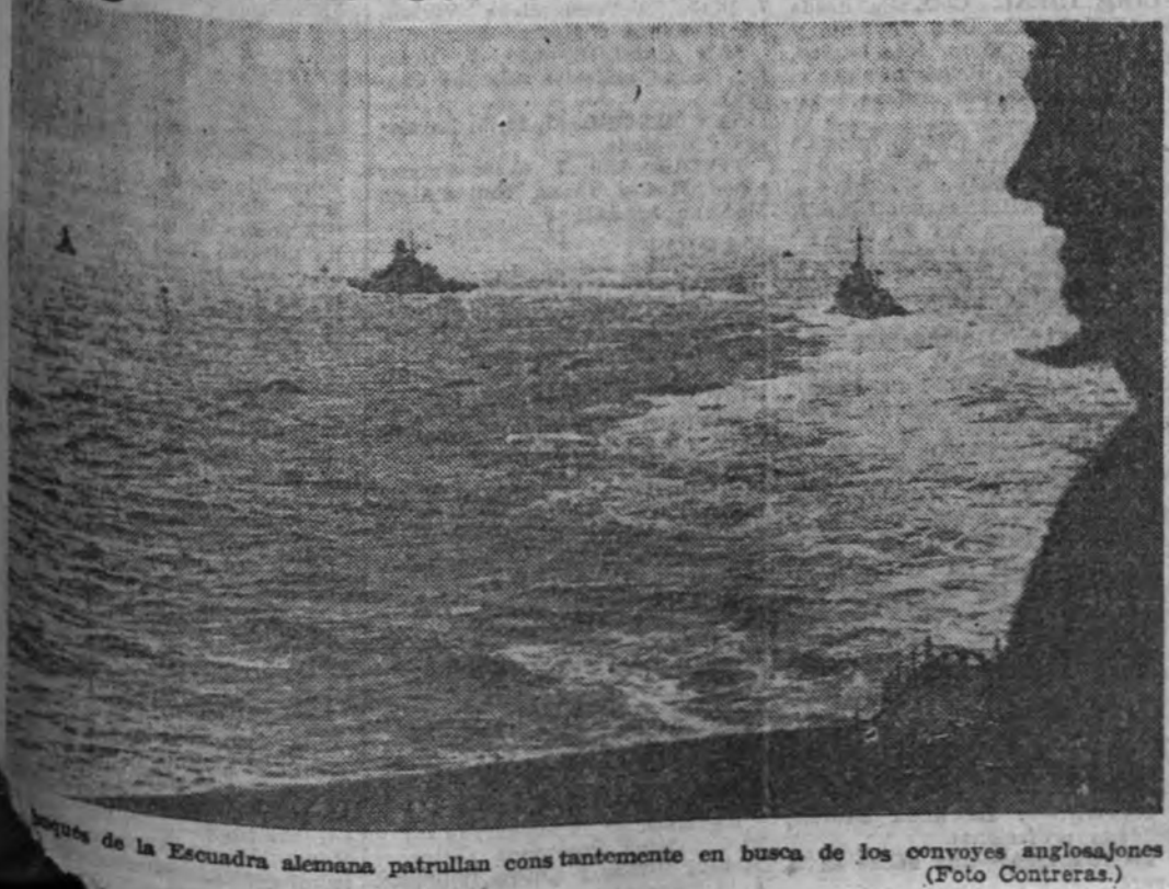
La Escuadra alemana patrulla constantemente en busca de los convoyes angloamericanos.