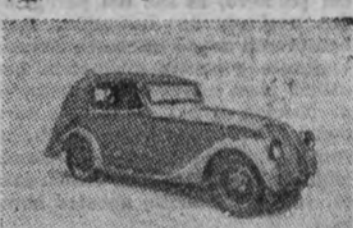
Tipo de coche, de servicio público, con acumuladores

tal suerte, que por los Estados Unidos circulan en la actualidad 19.000 camiones, que oscilan de una a cuatro toneladas de carga. A ellos están encomendados los servicios de Correos, Mercados, Sanidad, reparto en los grandes almacenes, servicio funerario, Casas de Socorro y todos los servicios municipales.