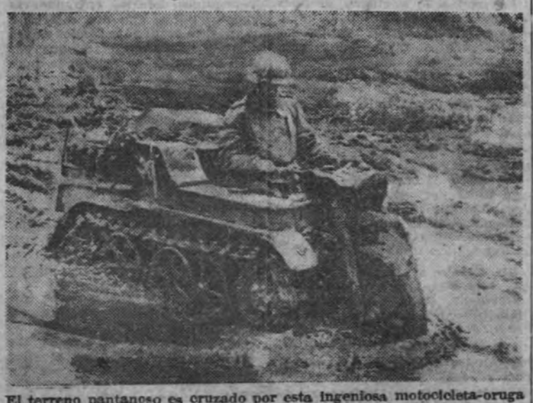
El terreno pantanoso es cruzado por esta ingeniosa motocicleta-óruga que ha adoptado el Ejército alemán para el Servicio de Enlaces