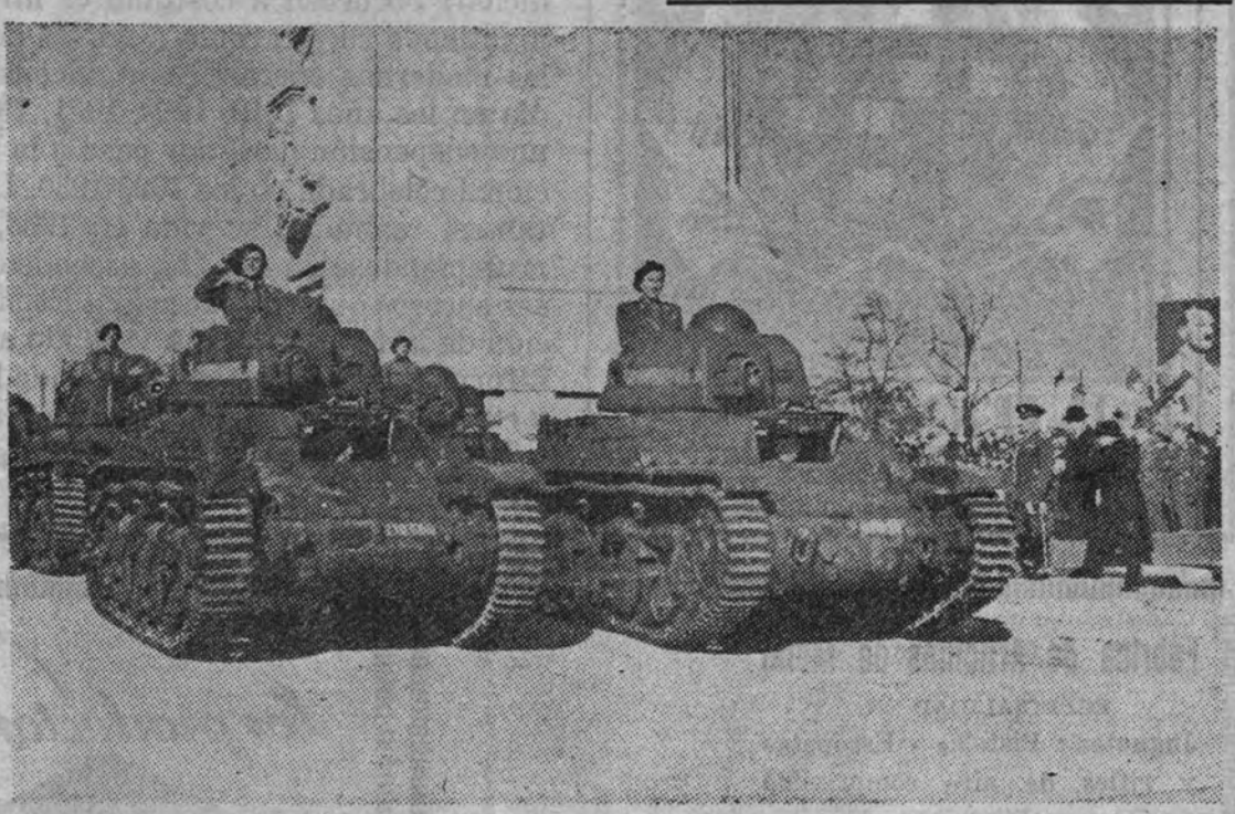
El desfile de la Victoria en Bucarest

En los modelos franceses, y que, como éstos, carecían de todo pensamiento que no fuera el de sus propios intereses; una juventud sin ímpetu y sin moral; tales eran los principales elementos de la vida pública rumana en aquel momento que el destino había elegido para salvar a la nación rumana.