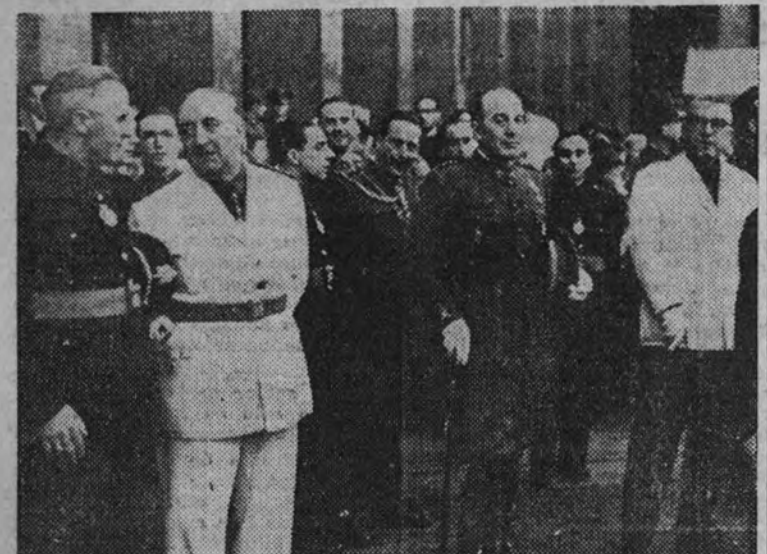
Las autoridades que presidieron la solemne procesión celebrada ayer

gastadores del Frente de Juventudes, le fueron arrojadas gran cantidad de flores.