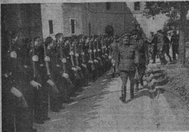
Franco revista a la Centuria del Frente de Juventudes que le rindió honores ante la Fábrica de Armas de la Vega.

Acompañan a S. E. el Jefe del Estado en su viaje de regreso el capitán general de la región, general Solchaga, y los jefes de sus Casas Militar y Civil.