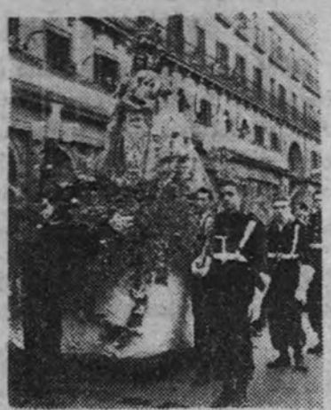
Cadetes del Frente de Juventudes dan guardia a la imagen de la Virgen de la Almudena.

Durante el paso de la imagen de Nuestra Señora de la Almudena, que iba ataviada con el rico manto regalo de Isabel II, y le daban guardia de honor milicias de la Centuria de Honor de la Falange de Primera Línea, con armas, y