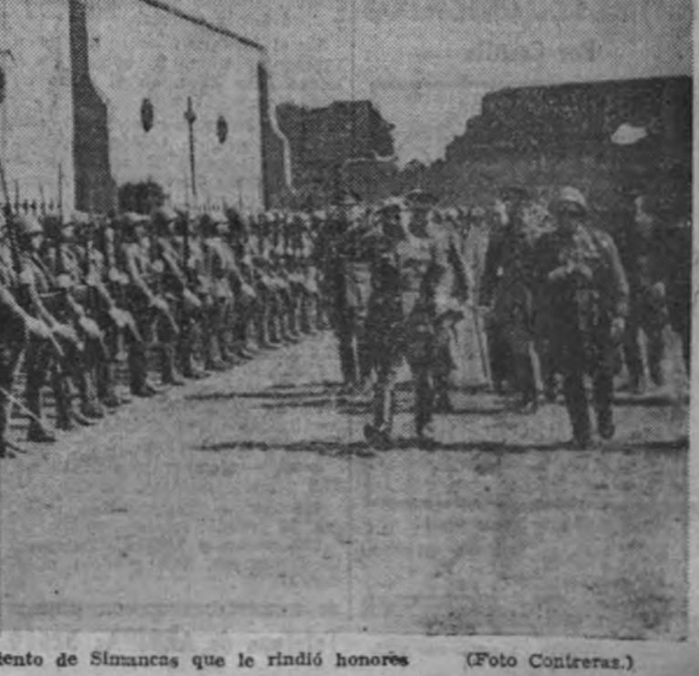
El Generalísimo pasa revista a la compañía del regimiento de Simancas que le rindió honores.

BERLIN 8. — Entre el 6 y el 8 de septiembre la Aviación soviética ha perdido 168 aviones. De esta cifra, 125 fueron derribados en combates aéreos, en los que participaron aviones de caza italianos, croatas y húngaros; 40 aparatos, destruidos por la D. C. A., y tres destruidos en el suelo. Durante el mismo tiempo fueron derribados cinco aparatos alemanes. (Efe.)