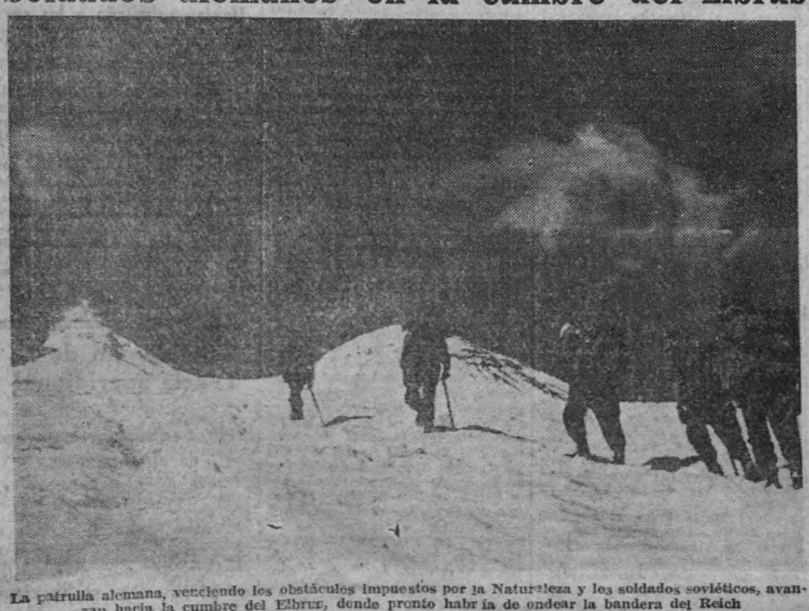
La patrulla alemana, venciendo los obstáculos impuestos por la Naturaleza y los soldados soviéticos, avanzó hacia la cumbre del Elbrus, donde pronto habrá de ondear la bandera del Reich