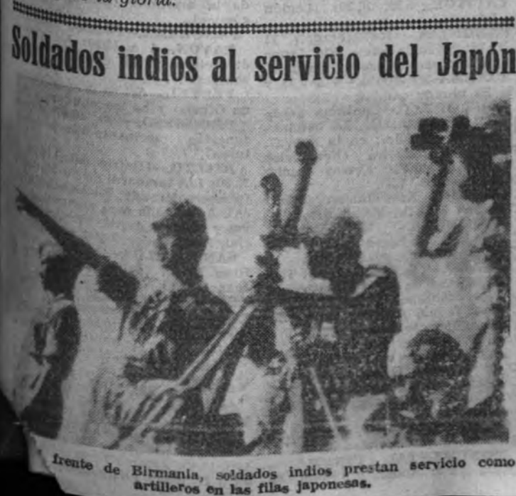
Frente de Birmania, soldados indios prestan servicio como artilleros en las filas japonesas.