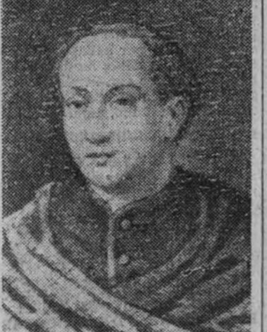
Cristóbal Colón, del «Museo degli Uffizi» de Florencia

(1) Acaso esta verba muy fresca que trae como fruta no eran nada más que gas, sargazos y fucus que ya se había en nota, y la idea los conceptuales de los frentes de los fucus, la muestra pradera flotante que forman al acumularse en el remanente del circuito de las corrientes se ha llamado Mar de los fucus y ocupa en el Atlántico Setentrional extensión superior a 200 millas cuadradas. —D.