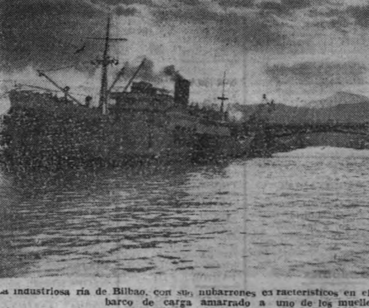
La industriosa ría de Bilbao, con sus nubarrones, característicos en el horizonte. En primer término, un barco de carga amarrado a uno de los muelles comerciales

BARCELONA 11.—El pintor D. José María Sert se ha trasladado esta tarde a Vich, para visitar las obras de reconstrucción de aquella catedral. Le acompañaron varias personalidades que forman parte de la Junta de Reconstrucción. En Vich fué cumplimentado por el dñ de la catedral y varias autoridades locales. Se dirigió seguidamente al templo, donde inspeccionó el curso de las obras que en el mismo se efectúan. El ilustre artista estudió sobre el terreno la colocación de los primeros lienzos decorativos, crucero de la catedral, los cuales están listos y en camino de Vich. Terminada la visita, regresó a Barcelona. (Cifra.)