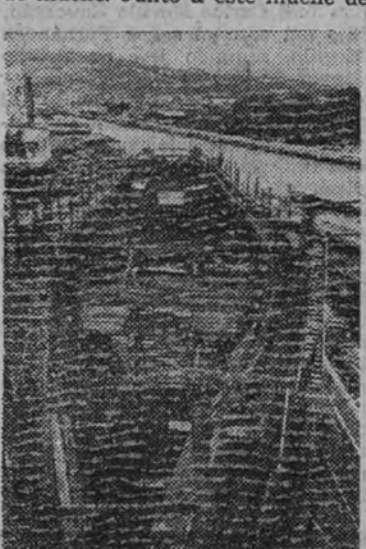
Un barco en construcción en los astilleros de Euskalduna

Para este menester dispone Euskalduna de 705 metros de longitud de muelle. Junto a este muelle de