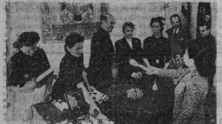
El Delegado Nacional de Artesanía en el momento de hacer entrega de los diplomas a las cursillistas.

El Delegado Nacional hizo entrega de los diplomas