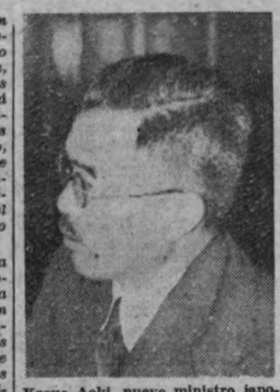
Kazuo Aoki, nuevo ministro japonés sin cartera.

El mundo de los «ismos» tiene muy poco que hacer en la hora actual. Todo lo que es aceptable es una demostración ingeniosa de la pintura aérea y biográfica que lasan andanamente bajo los auspicios de Marinetti las exposiciones