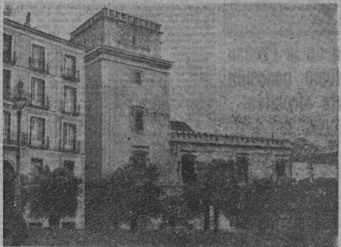
La Torre de los Lujanes, edificio señorial que alberga la Hemeroteca del Municipio de Madrid

En su archivo figuran la más antigua publicación española (1599) y el "Die Frankfurter Oberpostand Zeitung", decano de los diarios mundiales