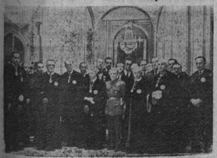
El general Jordana con las demás personalidades asistentes a la reanudación de las sesiones del Consejo de Estado, en cuyo acto recibió el ministro de Asuntos Exteriores una cariñosísima despedida (Foto Contreras).