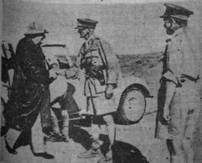
El primer ministro británico, señor Churchill, visitando la plaza de Argel, en la que se detuvo durante su último viaje a Moscú