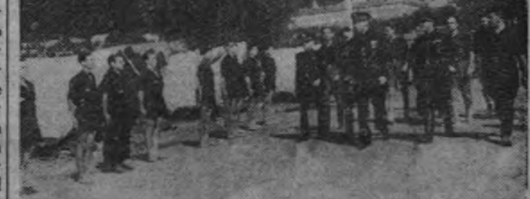
El Vicesecretario General del Partido revisando a los Jefes de Comandancia en el acto inaugural del Consejo.

A continuación prosigue el camarada Anibal la exposición del tema de los instructores, y habla de los tres grupos de enseñanzas que en la Academia han recibido. (Continúa en cuarta página.)