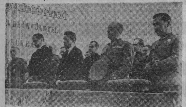
La presidencia durante la misa celebrada en la prisión de Portier

La Diputación asistió a los actos celebrados en el Colegio de las Mercedes