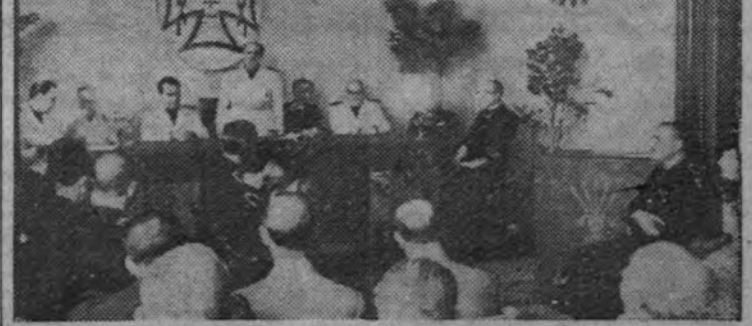
Sesión inaugural del I Congreso de ex Cautivos.

El acto de clausura tendrá lugar hoy en el Salón de Ciento del Municipio barcelonés