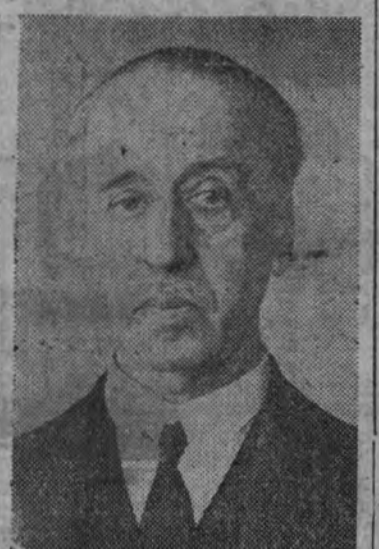
U. Joaquín Benjumea Burín, ministro de Hacienda

Por otra parte, la operación ha sido planteada por la Hacienda Nacional, que con tan ponderado equilibrio conduce el ministro del ramo, señor Benjumea, con un gran sentido positivo y justo, armonizando una