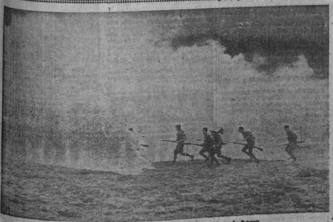
Operaciones de la infantería protegida por nubes de humo