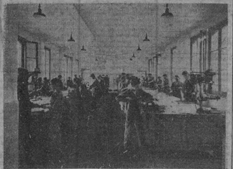
Sección de ajuste

El total del personal que trabaja en la Sociedad Española de