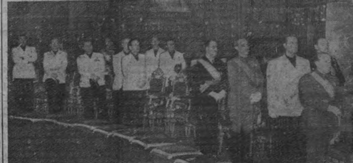
El Gobierno en la ceremonia celebrada en la Iglesia de San Francisco el Grande

LISBOA 1.—El jefe del Gobierno portugués, doctor Oliveira