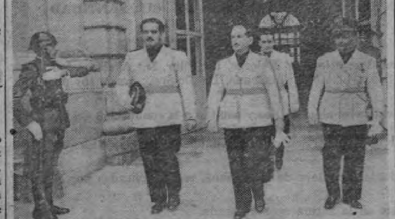
Los ministros Secretario del Partido, de Trabajo y de Industria y Comercio, al salir de Palacio