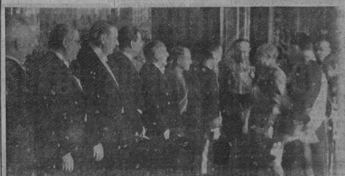
El Cuerpo Diplomático cumplimenta al Caudillo en Palacio durante la recepción

“Los pueblos alemán e italiano saludan al Caudillo y a su país como viejos camaradas”