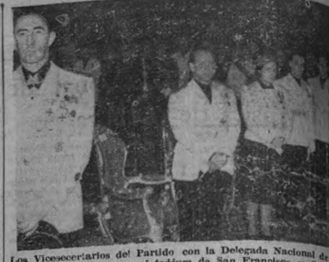
Los Vicesecretarios del Partido con la Delegada Nacional de la Acción Feminista, en el tedum de San Francisco de Asís.

Art. 19. Quedan derogadas cuantas disposiciones contrarias a las presentes.