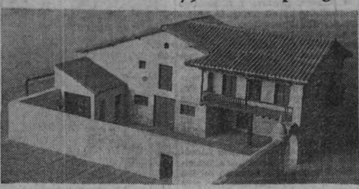
Tipo de vivienda aislada de la región montañesa (Santander)

En las ciudades, corrientemente es más fácil la labor divulgadora, pues el funcionario y el obrero po-