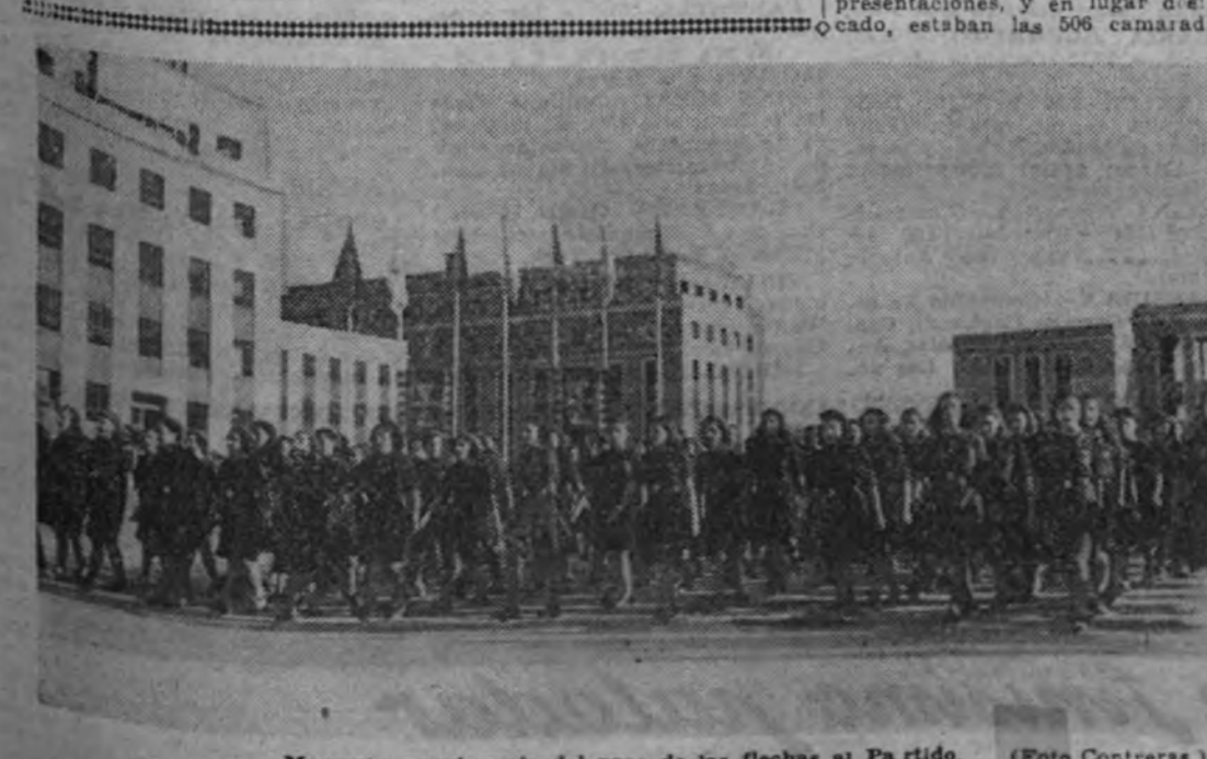
Momento emocionante del paso de las flechas al Partido.

Pero los relevos se suceden en las escuadras falangistas por que en ellas, por encima del dolor, está el ejemplo que mantiene nuestra fe y la obstinación en nuestra empresa.