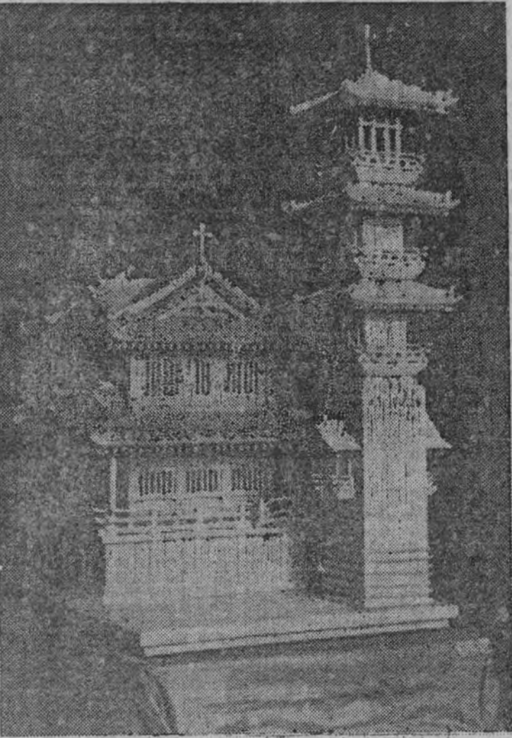
En todo el mundo se dirigen en el día de hoy las predicaciones en todas las iglesias de la tierra y las oraciones de todos los fieles.

destinado y anunciado para este número de nuestro suplemento. Es de hoy, por razones materiales de tiempo no ha podido ser incluido en él y aparecerá en un próximo folleto de ARRIBA.