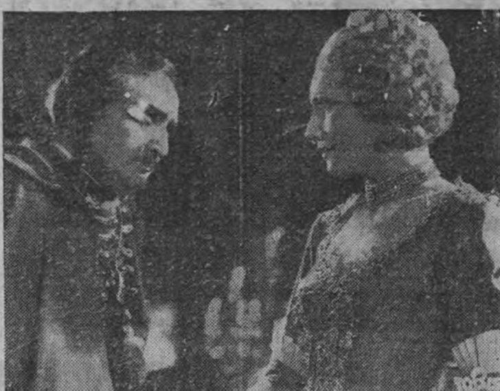
Hans Albers y Hilde Weissner en una escena de "Corazón de fuego", que se estrena el lunes en el cine Imperial.