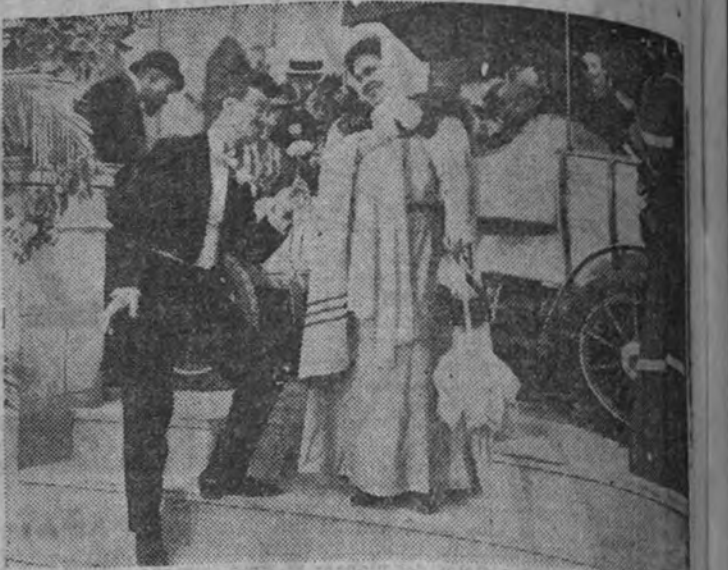
Una divertida escena de la graciosa película "Viaje sin destino", que se proyecta con éxito en segunda semana en el cine Rialto.

Mañana, lunes, entra "Goyescas", la producción nacional editada por Unibsa, dirigida por Benito Perojo y distribuida por Flimofono, es el éxito de la temporada... y de muchas temporadas. El público forma colas interminables ante las tequillas del Palacio de la Música por admirar el arte maravilloso de la genial intérprete, Imperio Argentina, la máxima figura española del cine mundial.