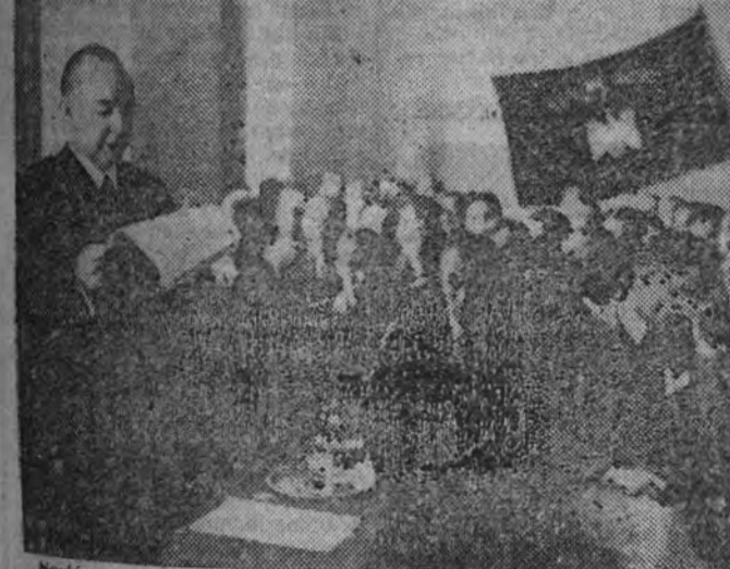
Sección Inauguración de curso en la Escuela Especial de Ingenieros de Montes