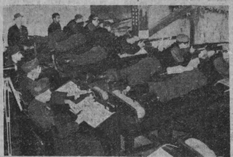
El polígono de tiro milanes de la Cagnola, en la tirada del equipo español.