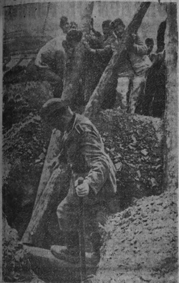
En los frentes estabilizados actualmente en Rusia es necesario preparar segundas líneas fortificadas para prevenir posibles contraataques rojos.

"Necesitamos, desde los primeros años, grabar en el ánimo de nuestra infancia, en conceptos sencillos, las verdades de nuestra doctrina y la idea firme de sacrificio por nuestra unidad, construida sobre principios eternos extraídos de nuestra Historia y de los preceptos del Evangelio."