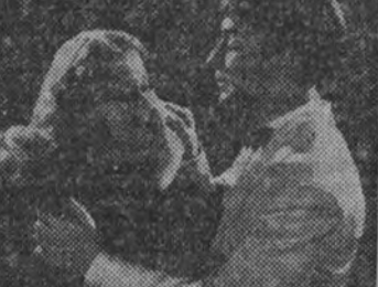
Charles Butterworth en "Cupido sin memoria", que se proyecta a partir del lunes, día 19, en el cine San Miguel.