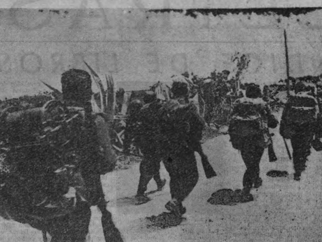
Los soldados alemanes, pelean en todos los climas. Los son familiares las llanuras nevadas y los pozos de los oasis. A través del desierto, una avanzadilla marcha a emplazarse en la nueva posición conquistada.