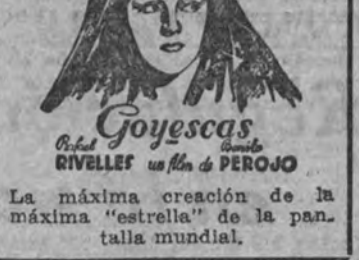
La máxima creación de la máxima "estrella" de la pantalla mundial.

Para todo lo relacionado con esta sección, dirigirse al redactor encargado de la misma.