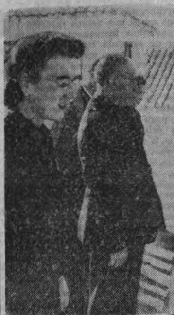
El Caudillo durante los actos