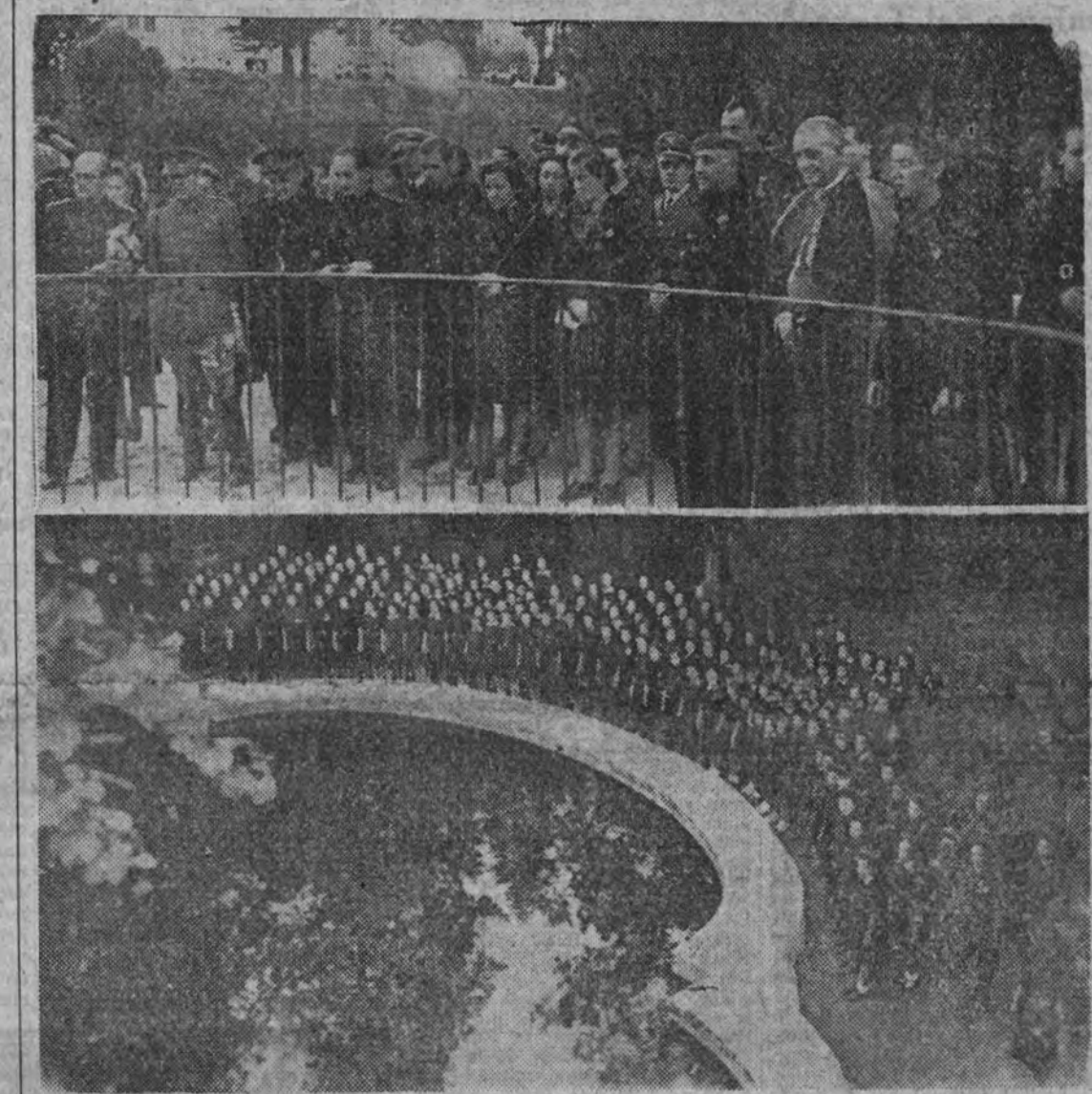
Los coros de la Sección Femenina interpretan diversas canciones en presencia del Caudillo y de las personalidades que asisten al acto.

Ciento catorce camaradas tomarán parte en este primer curso de la Academia de Mandos