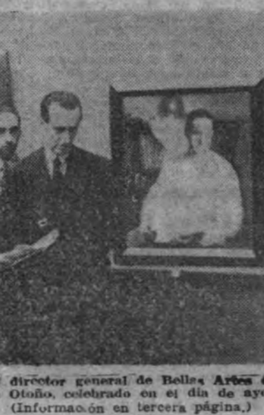
El ministro de Educación y el director general de Bellas Artes en el acto inaugural del Salón de Otoño, celebrado en el día de ayer. (Información en tercera página.)

El ex ministro inglés de la Guerra habla de los éxitos alemanes