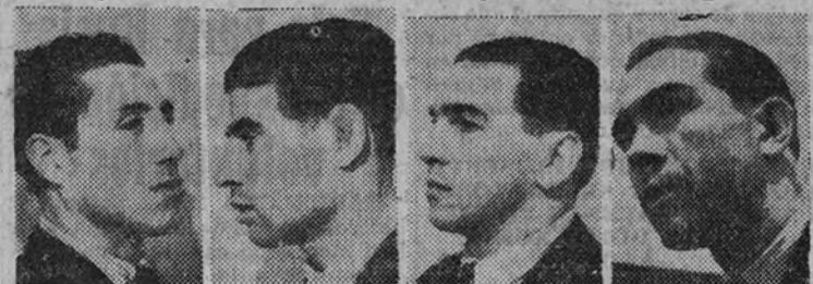
Nombre del jugador o oficial.

Sin la chispa de la pelea, el librero dejó fuera de combate a Solsona. La pelea entre Llovera y Soria no gustó.