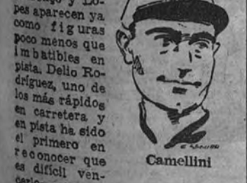
Nombre del ciclista.