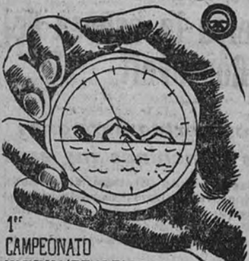
Logo del Campeonato Nacional de Educación y Descanso.

No se trata, por tanto, de conseguir mejores o peores marcas, sino de impulsar la afición de los productores. En un día de competición, en el que se disputarán pruebas de natación, se pretende que los participantes se diviertan y se ejerciten, pero que en esta ocasión se quiera salvar.