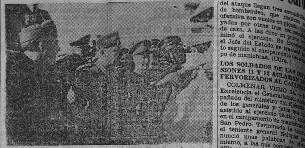
El general Rada explicando sobre el plano al Caudillo y demás invitados el supuesto táctico a realizar