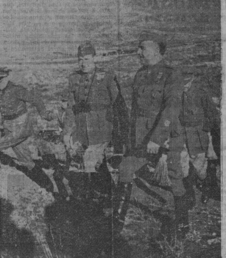
El Caudillo con el general Rada, seguido del ministro del Ejército, General Asensio, y del general Moscardó, se dirige al puesto de Mando para presenciar el ejercicio táctico.

Recordando de sus generales—los mismos que él supo llevar a la victoria—, Franco ha asistido ayer a una maniobra militar. Estas sencillas palabras bastarían para dar la noticia de la presencia del Generalísimo en las maniobras que, como final de sus ejercicios, celebró ayer la 13.ª división; pero serían, sin duda, insuficientes para dar idea de la jornada vivida ayer por Su Excelencia en el campamento que en Colmenar Viejo tienen las fuerzas que están bajo el mando del general Rada. Jornada de un alto valor castrense, y en la que una vez más el Caudillo pudo observar por sí mismo no sólo el magnífico grado de instrucción de la tropa y la capacidad de los mandos, sino el sincero homenaje de afecto y subordinación del Ejército, expresado de un modo palpable en los enervados victores y entusiastas aclamaciones con que fué acogida su presencia.