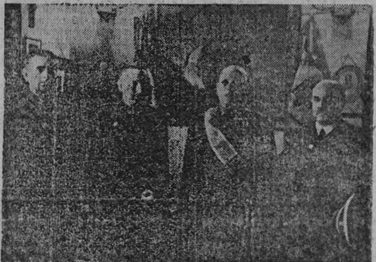
El general Millán Astray, con algunas de las personalidades que asistieron a la misa celebrada en la Dirección de Caballeros Mutilados con motivo de la festividad de su Santo Patrón