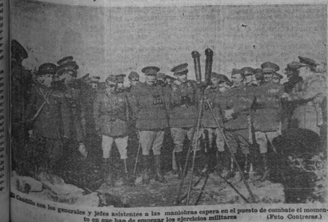
El Caudillo con los generales y jefes asistentes a las maniobras espera en el puesto de combate el momento en que han de empezar los ejercicios militares.