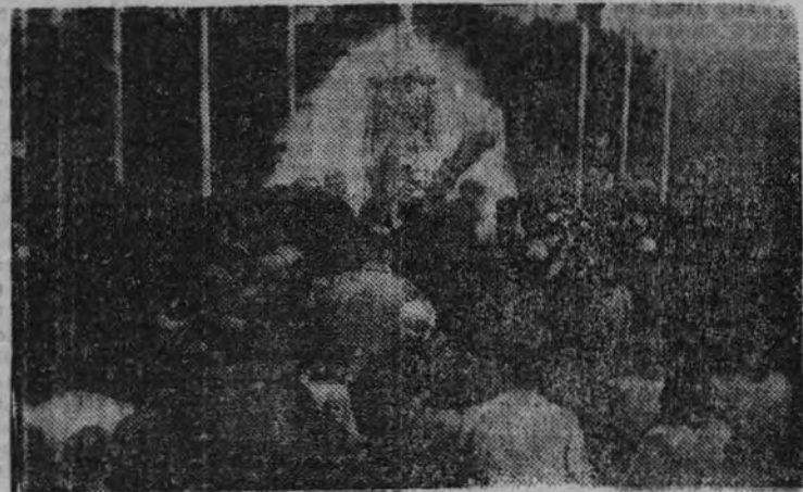
Hijos de ex cautivos en San Esteban de las Cruces.

Cuando las tropas de Franco aglutinaron la resistencia roja en Asturias y ya Belarmino Tomás se había puesto a salvo, dejando a sus milicianos en la estacada, se oyó un grito de liberación en la vida alta de San Esteban de las Cruces, posición dominante de la ciudad sometida al fuego durante dieciséis meses de guerra. Por la cuenta del Cementerio abajó se descolgaron, en carrera vertiginosa, centenares de personas —hombres y mujeres— en busca del abrazo amigo que los compensara de un cautiverio cruel. No pocos cautivos agotaron las últimas fuerzas y cayeron extenuados entre líneas hasta ser recogidos por los soldados, que aun no habían recibido órdenes de avanzar hasta el territorio que había abandonado el enemigo. Parecían entonces aquellos hombres de rostros demacrados, largas melenas y destrozados trajes, cristianos que salían de tenebrosas catacumbas-refugio, para huir de la persecución de los Emperadores.