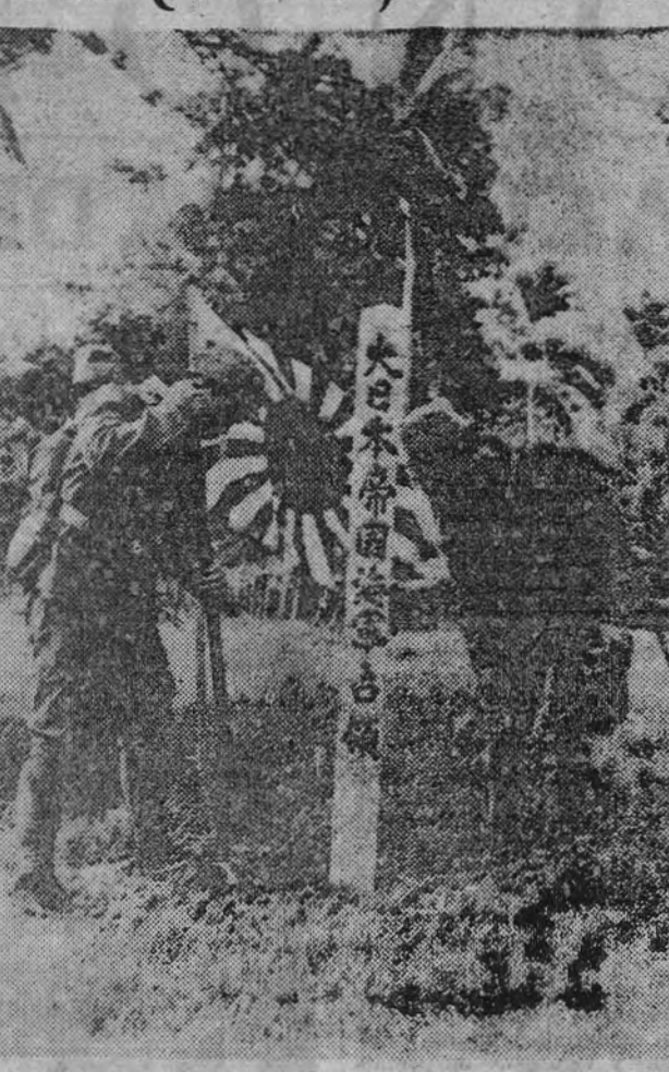
Los soldados japoneses clavan en la tierra de una isla del Pacífico, retén conquistada, sus banderas y postes con letreros en los que indican su posesión.