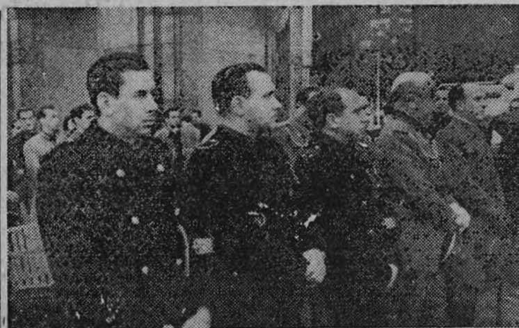
Autoridades y jerarquías que presidieron la misa por los Caidos