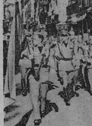
Las Milicias del S. E. U. desfilando ante las jerarquías del Partido