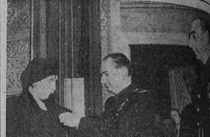
El ministro Secretario del Partido imponiendo la Medalla de la Vieja Guardia a los familiares de los caídos