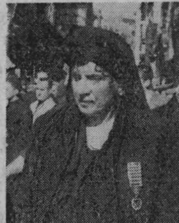
La madre y esposa de los García Noblejas ostenta la medalla de la Vieja Guardia con seis pasadores

el desfile falangista y escuchar el discurso de José Antonio, retransmitido por los servicios de la Red Nacional de Radiodifusión de la Vicepresidencia de Educación Popular. Los edificios lucían colgaduras nacionales y del Movimiento con crepones negros y los tranvías también lucieron las banderitas de los colores de España en los troles.