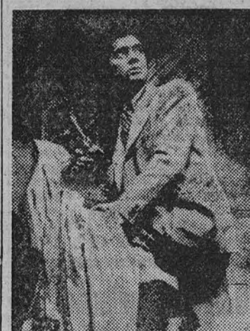
El cine San Miguel anuncia el estreno de "Viejo sin destino", uno de los grandes éxitos de la temporada cinematográfica. Reproducimos una escena de este film, en el que actúa como protagonista, bajo la dirección de Rafael Gil, el notable galán Antonio Casal.

Por la atracción de la irresistible figura de Marlene. Por la simpática seductora de Melvyn Douglas. Por la magnánima generosidad de Herbert Marshall. Por la cautivadora belleza del ambiente. Por la excelente dirección del magno del arte cinematográfico, Ernst Lubitsch. Por todos estos motivos, como el fuera un brinco, la atracción de "Angel", que distribuye Chamartín, consigue una comedia llena de esa gracia y belleza que en España llamamos "Angel".