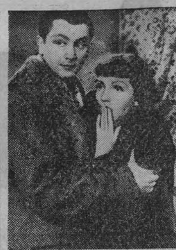
Robert Young y Claudette Colbert en una escena de la moderna comedia "La Encontre en Paris", título al que espera un inmediato éxito.