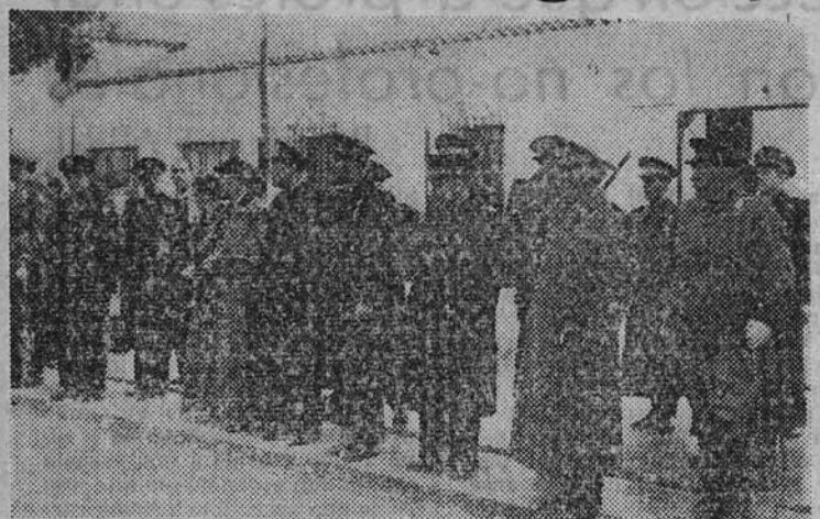
El Gobierno espera el paso del Caudillo