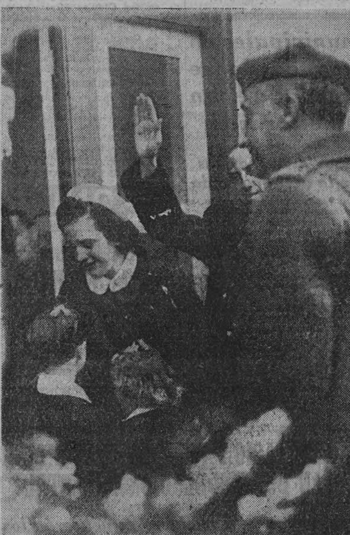
Los pequeños reciben al Caudillo

El edificio blanco, de sencillo estilo campesino, entre manzanas y andaluz, es una nota gratísima entre aquellas construcciones miserables de la carretera del Este, a cuya población infantil, a las madres embarazadas o lactantes, y, en general, a los necesitados,