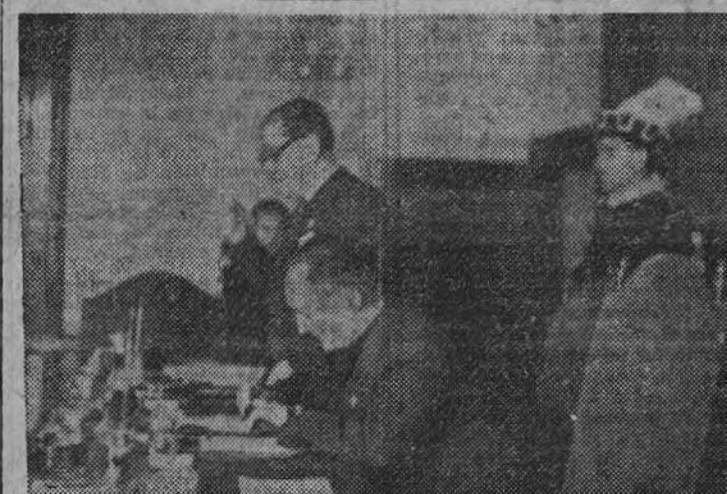
El presidente de la Diputación, camarada Nieto Antón, firmando el acta de la elección de procuradores en Cortes en la Diputación Provincial.

Además, son Procuradores natos, por razón de sus cargos, los alcaldes de los Ayuntamientos de cada capital de provincia y las treinta y nueve jefaturas sindicales que dispone el artículo 1.º del decreto de representación sindical de 14 de octubre de 1942.