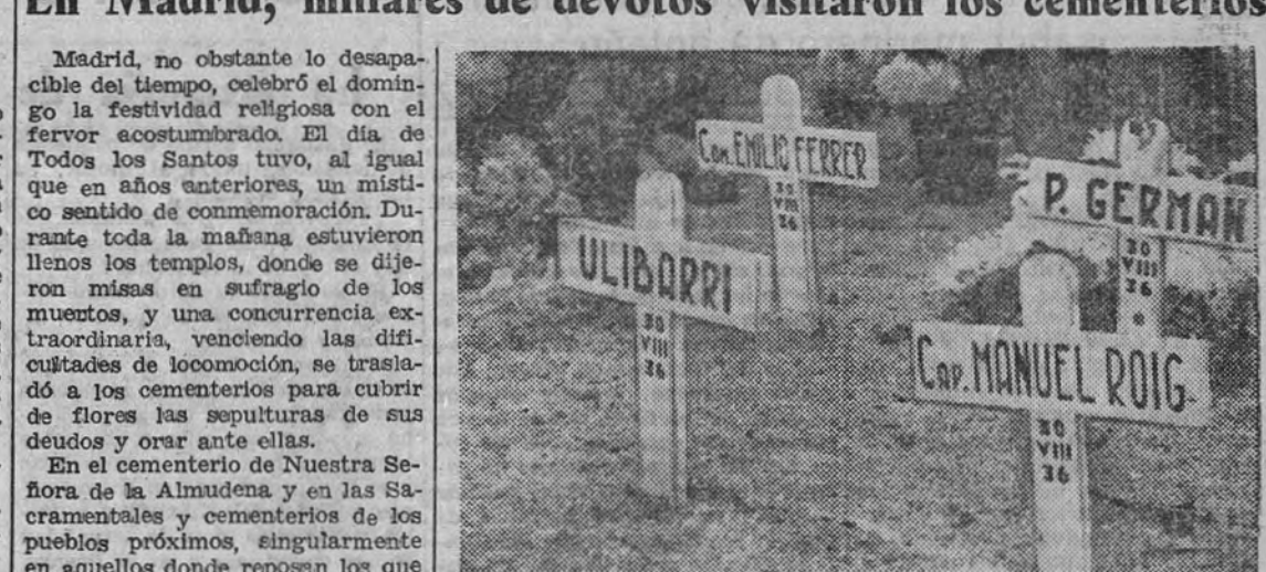
Un rincón del cementerio de Aravaca, en el que pueden verse varias tumbas de algunos de los mártires identificados de los centenarios que la barbarie roja inmoló en aquel lugar.

En Madrid, millares de devotos visitaron los cementerios