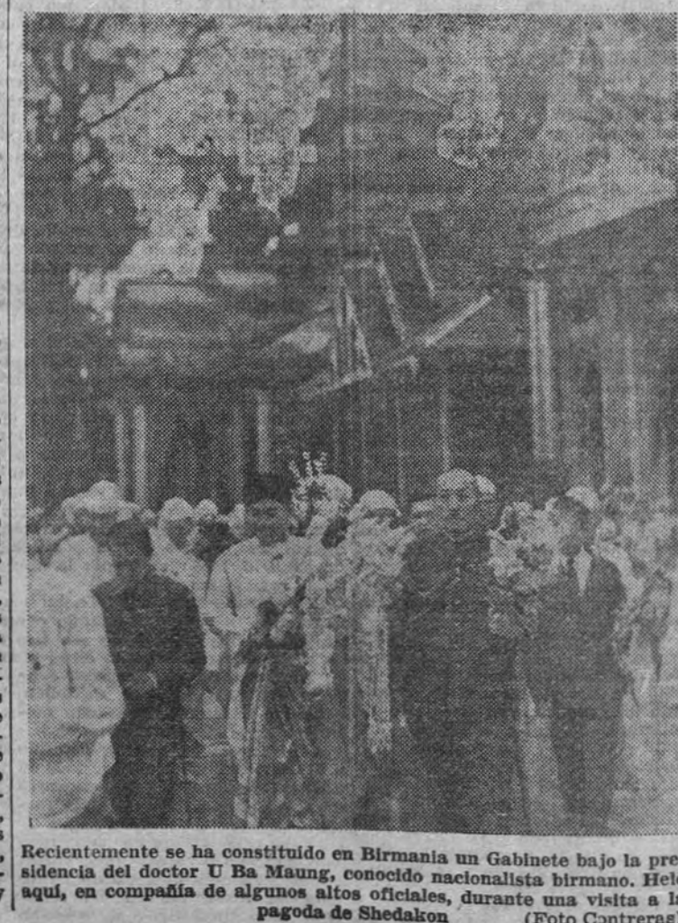
Recientemente se ha constituido en Birmania un Gabinete bajo la presidencia del doctor U Ba Maung, conocido nacionalista birmano. Hela aquí, en compañía de algunos altos oficiales, durante una visita a la pagoda de Shadakon