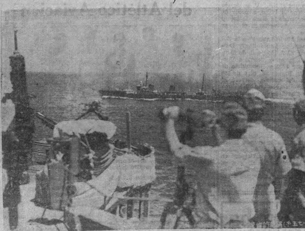
Unidades de la Escuadra nipona navegan en busca del adversario