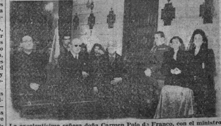
La excelentísima señora doña Carmen Polo de Franco, con el ministro de Educación Nacional, camarada Ibañeta Martín y otras personalidades, en la inauguración de la capilla del Hospital de San Carlos.

Asistieron a la ceremonia la esposa del Caudillo y el ministro de Educación Nacional