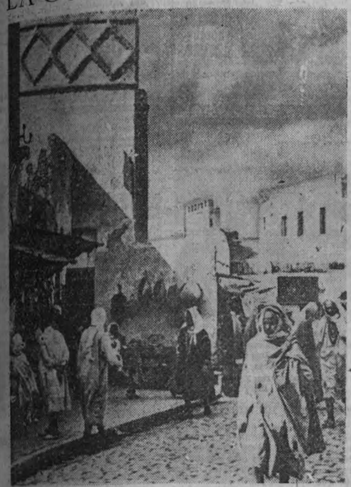
Una típica calle de Túnez.

ESPAÑA NO ES SOLO UNA GEOGRAFIA: ES TAMBIEN UNA EXPRESION A REALIZAR.