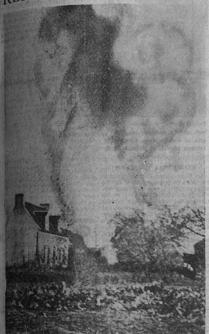
De la ciudad de Stalingrado sólo quedan ya, después de la gran batalla, sobre ella sostenida, montones de ruinas humeantes