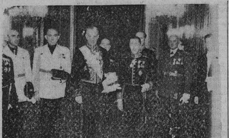
El nuevo ministro de Suecia, señor Westman, en la antecámara de Su Excelencia el Jefe del Estado, momentos antes de presentar sus credenciales al Caudillo.

Me permito esperar que en el desempeño de mi cargo contaré con el alto apoyo de Vuestro Excelencia y con el concurso valioso y cordial de su Gobierno. Formulo mis mejores votos por la prosperidad del pueblo español y por la felicidad personal de Vuestro Excelencia.