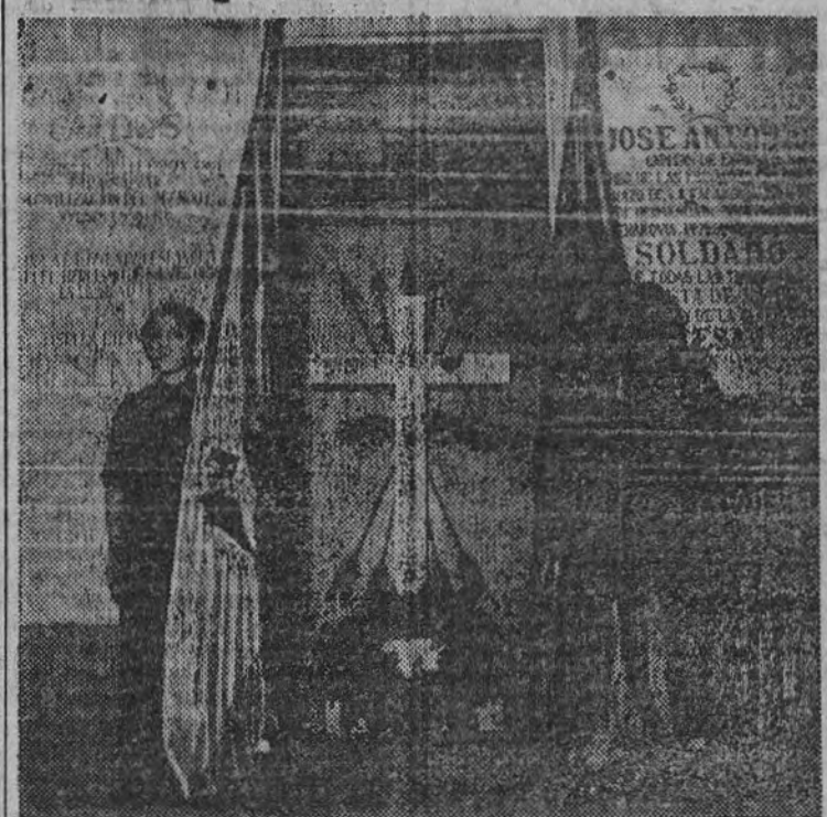
La Falang de París, acaba de inaugurar un Cuartel de flechas. Dos pequeños camaradas dan guardia a la Cruz de los Caídos de su nueva Casa en el acto inaugural