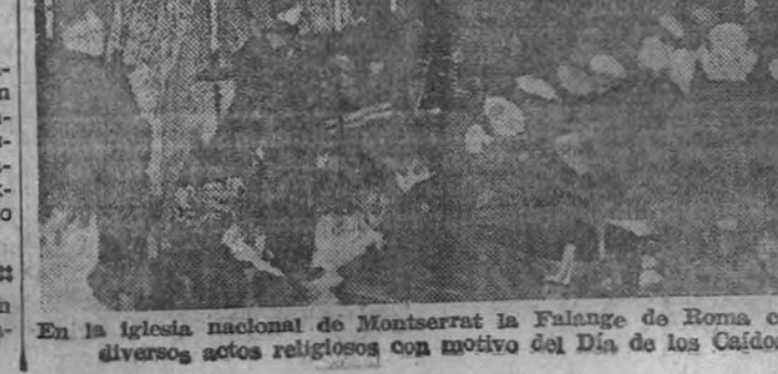
En la Iglesia nacional de Montserrat la Falange de Roma celebró diversos actos religiosos con motivo del Día de los Caídos