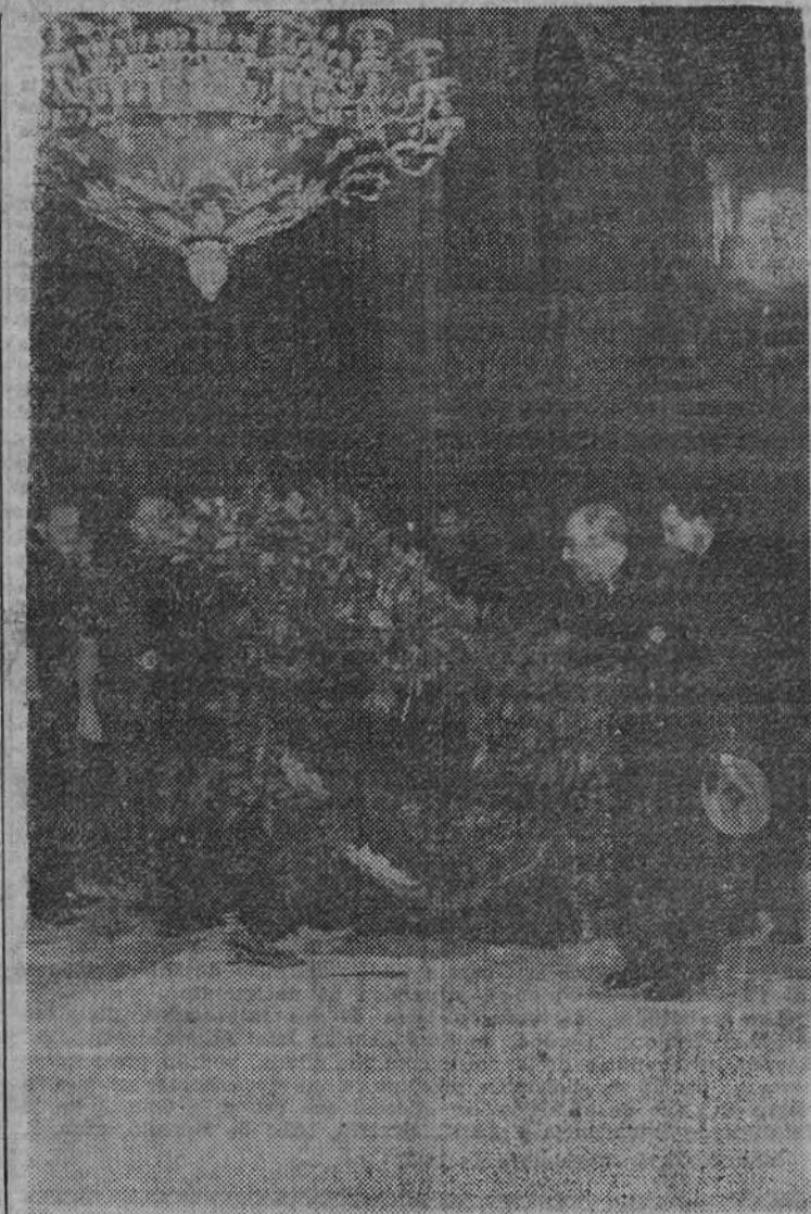
El Jefe Nacional de Falange deposita la corona de laurel sobre la tumba de José Antonio

Al contemplar la Lonja parece como si el tiempo se hubiera detenido. El severo ornato de la Lonja nos retrotrae a otras épocas. Parece como si nos halláramos bajo el reinado del más grande de los Felipe. Más de veinte altos doselados entoldados se levantan en el amplio recinto, y bajo ellos y sobre pequeñas tribunas se hallan colocados otros tantos timbales enormes, cubiertos con negros crespones. Sobre cuatro tribunas altas, en negro, nutridas representaciones de la Sección Femenina, División Azul, Vieja Guardia y Frente de Juventudes aguardan a pie firme la llegada del Jefe Nacional de la Falange. Se oyen las primeras notas del Himno Nacional, y simultáneamente los timbales comienzan a redoblar, lenta, solemnemente. El Caudillo avanza solo, con majestuosidad, por medio de la Lonja, mientras la Vieja Guardia, portando la corona, sale a su encuentro desde la parte opuesta. El momento tiene una extraordinaria grandiosidad. Hay una emoción honda, incontestable, en los asistentes. El sordo sonar de los timbales llena todo el ámbito y sus ecos resuenan y se multiplican como si chocaran y rebotaran en la mole de granito. El Caudillo penetra detrás de las andas en el Patio de los Reyes y el redoblar de los