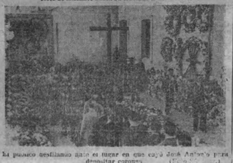
El puñado desfilando ante el lugar en que cayó José Antonio para depositar coronas

El Presidente de las Asociaciones europeas felicitó a nuestros Jefes de Prensa