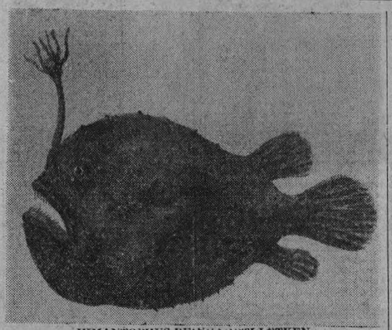
HIMANTOPHUS REINHARDTI LUTKEN

El memorial de Santa Elena continúa publicándose en "El Español". Compre usted "El Español", que aparece los domingos.