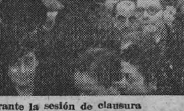
El ministro de Educación Nacional, en la clausura del acto

El próximo viernes, día 27, inaugurará la revista "Escorial" su curso de conferencias 1942-43. La primera conferencia del curso será dada por el Consejero Nacional de Falange Española Tradicionalista y de las J. O. N. S., camarada Eduardo Aunós, que disertará sobre el tema "Viaje sentimental a Buenos Aires".