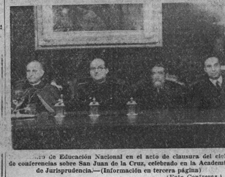
Centro de Educación Nacional en el acto de clausura del ciclo de conferencias sobre San Juan de la Cruz, celebrado en la Academia de Jurisprudencia. (Información en tercera página)