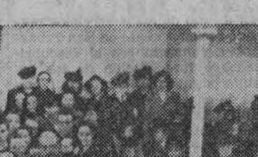
Un aspecto de la sala durante la sesión de clausura

Afortunadamente, la artista ha pasado ya por los momentos de mayor gravedad, pudiéndose asegurar que dentro de pocos días estará completamente restablecida.