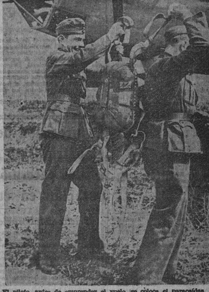
El piloto, antes de emprender el vuelo, se coloca el paracaídas, en previsión de cualquier accidente