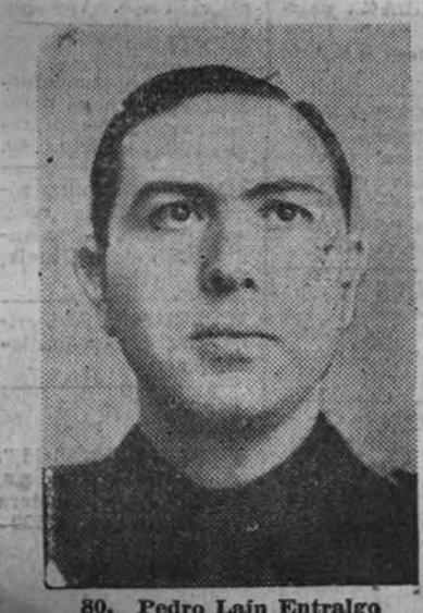
80. Pedro Laín Entralgo