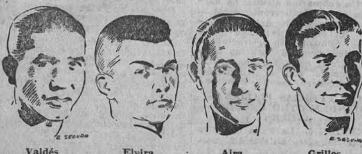
Figuras nuevas y viejas del equipo castellano

Los campeonatos nacionales de aficionados de este año han de celebrarse en Bilbao como homenaje al deporte que viene realizando los aficionados de esta zona. Los campeonatos de aficionados de este año han de celebrarse en Bilbao como homenaje al deporte que viene realizando los aficionados de esta zona.