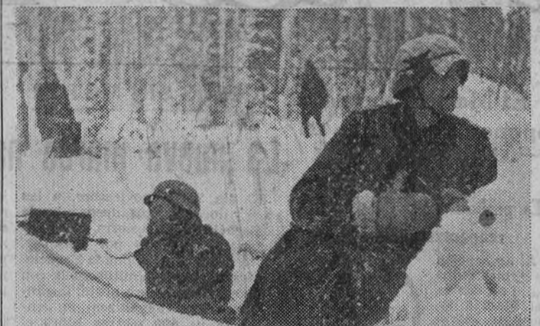
Un puesto de Transmisión, mantiene su servicio entre la nieve, que ya cubre las posiciones.