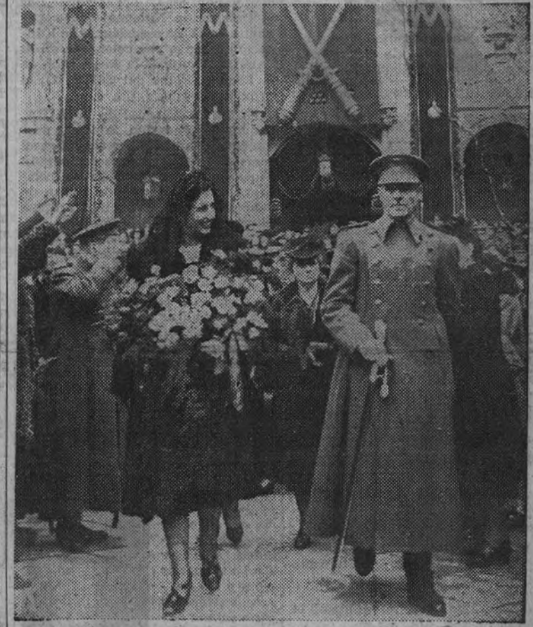
La esposa de S. E. el Jefe del Estado, acompañada del general Asensio, ministro de la Guerra, a la salida de la festividad religiosa con que el Arma de Artillería ha celebrado el día de Santa Bárbara

Fué presidida por los ministros del Ejército, Aire, Marina y Asuntos Exteriores