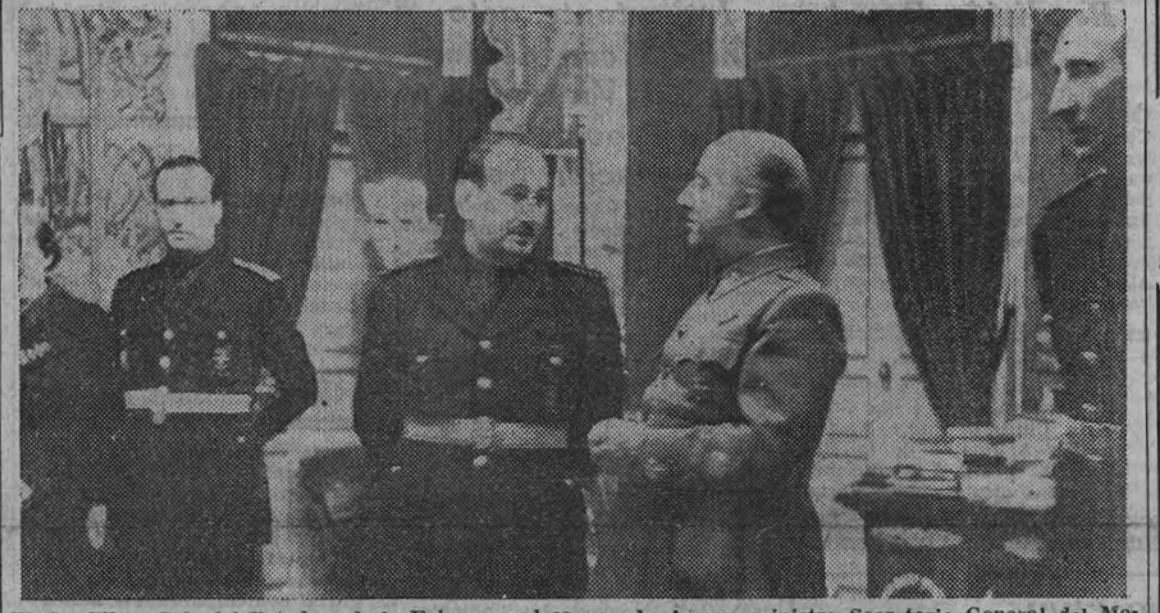
El Caudillo y Jefe del Estado y de la Falange y el camarada Arrese, ministro Secretario General del Movimiento, durante la visita que a aquél hicieron las altas jerarquías de la Falange para felicitarle con motivo de su cumpleaños

El Caudillo, en breves y vibrantes palabras, contesta al camarada Arrese, que con los Vicesecretarios y Delegados Nacionales del Movimiento le felicitó en su cumpleaños