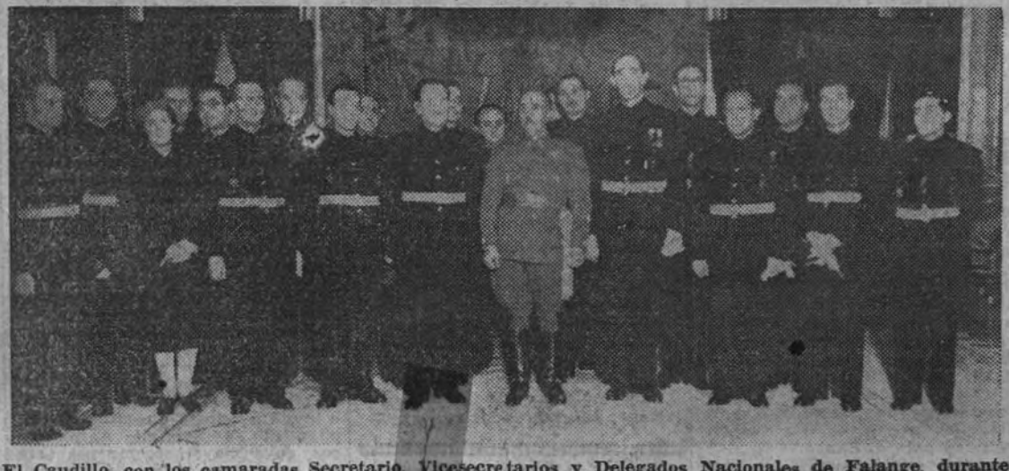
El Caudillo, con los camaradas Secretario, Vicesecretarios y Delegados Nacionales de Falange, durante la visita.