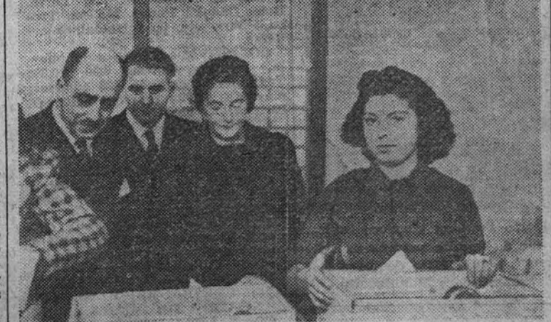
El ministro de Marina, acompañado de Pilar Primo de Rivera, visita los trabajos de las camaradas de la Sección Femenina que confeccionan los paquetes con el aguinaldo para los voluntarios de la División Azul