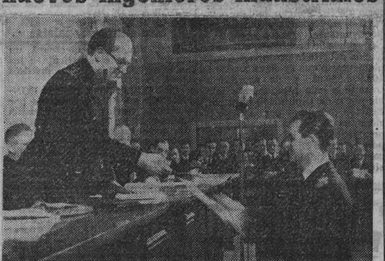
El ministro de Educación Nacional en el momento de hacer entrega de los premios

En el Aula Magna de la Escuela Especial de Ingenieros Industriales, el ministro de Educación Nacional entregó solemnemente en la tarde de ayer los títulos académicos a los nuevos ingenieros industriales que han terminado sus estudios en la promoción 1941-42.