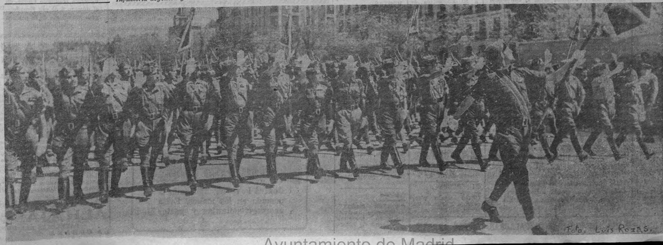
Avuntamiento de Madrid