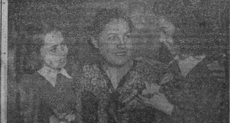
Dos niñas azules entregando el regalo a su madre