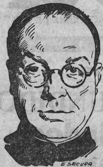
ciembre de 1940, habiendo cursado estudios teológicos durante los dos años en el Seminario matritense.

El día 1.º de año se va a cumplir el segundo aniversario de su primera misa, celebrada en la capilla de las Religiosas Asuncionistas, a cuya Comunidad pertenece una hija del finado. Su ordenación sacerdotal había tenido lugar hace dos años, precisamente en estos días, alcanzando la noticia entonces extraordinaria resonancia, dada la conocidísima personalidad del nuevo sacerdote en todos los medios intelectuales.