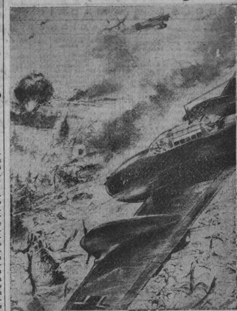
Un "Stuka" y un destructor, lanzándose en vuelo en picado contra las posiciones enemigas. Cuadro de un combatiente alemán, que sabe hacer compatibles las emociones bélicas con las estéticas

VERAMON Envasados originales: Tubos de 10 y 20 tabletas. Sobres de 2 tabletas de 0,4 gramos. Censura Sanitaria número 214