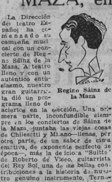
Regino Sainz de la Maza.

La Dirección del teatro Español ha organizado una campaña musical de carácter popular, en la que el primer concierto de Regino Sainz de la Maza, a la guitarra, se celebrará en el Español.