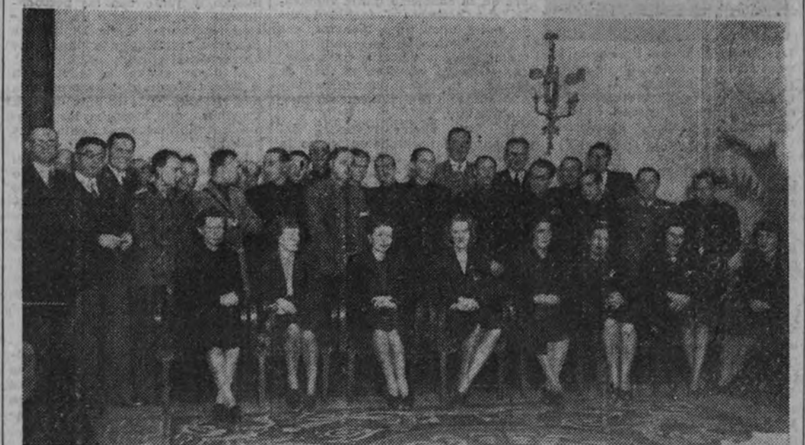
El Servicio Exterior de Falange ha obsequiado en una recepción a los representantes de las Juventudes extranjeras que asisten en Madrid a las reuniones sobre "Juventud y familia". Un aspecto del acto.

El Secretario Nacional del Frente de Juventudes pronunció el discurso de apertura