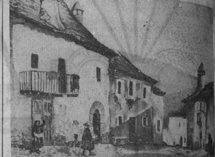
Uno de los interesantes paisajes que figuran en la notable Exposición del pintor Teodoro Carrasco, que se celebra con gran éxito en el Hotel Palace.