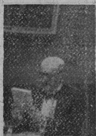
El conde de Romanones, durante su discurso.

En la tarde de ayer celebró sesión pública y solemnemente la Real Academia de la Historia para dar posesión de plaza de académico de número al director de la Real Academia de Bellas Artes de San Fernando, don Alvaro de Figueroa, conde de Romanones.