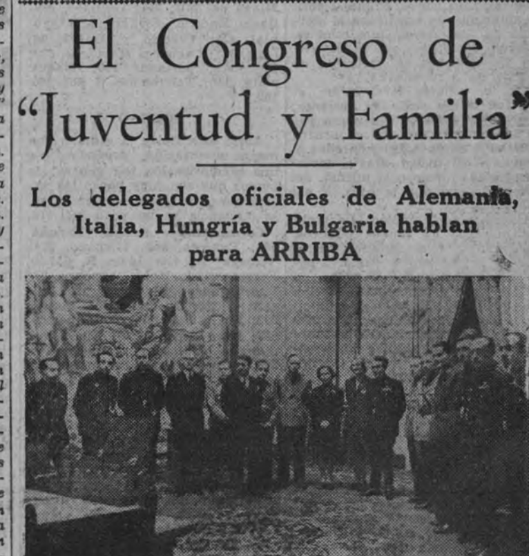
Los representantes españoles y extranjeros que asistían a las reuniones (Foto Contreras).