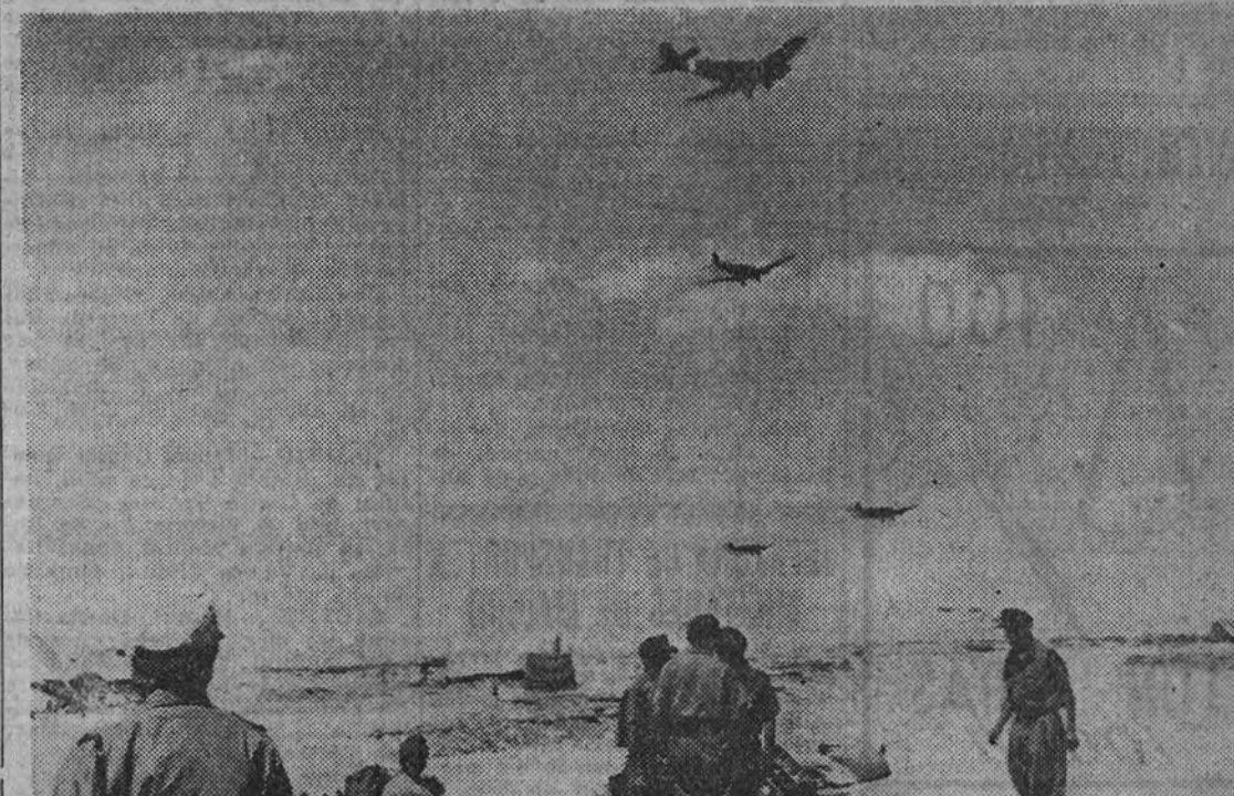
La otra cabeza de puente ha sido ocupada, es un aeródromo de campaña en la costa africana. Los aparatos son descargados a toda velocidad. Tras un breve descanso entre los camaradas del Cuerpo de África, que sienten los naturales deseos de saber cosa de la Patria, se parte de nuevo para ir a cargar otra vez con una actividad infatigable.

Dos columnas blindadas alemanas avanzan hacia MEDJEZ-EL-BAL