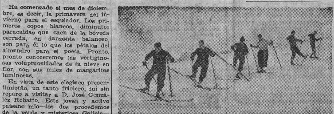
Entrenamiento y enseñanza de esquiadores. Planes de la Federación Centro para la temporada que empieza