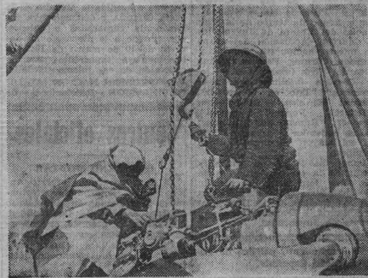
Indígenas de Túnez colaboran con las fuerzas del Eje en la reparación y puesta a punto de las máquinas de guerra.

ANCARA 12. (S. E. T.).—Informaciones de origen soviético señalan que el Gobierno de Moscú considera poco grata la presencia en la U. R. S. S. de la esposa del generalísimo chino Chiang Kai Chek, que desde hace tiempo tiene la intención de visitar Moscú. Se agrega que la Unión Soviética, que mantiene amistosas relaciones con Japón, no desea enturbiarlas por la presencia de dicha señora en Moscú. (Efe.)