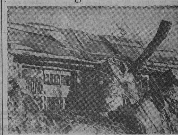
Este fortín tiene hasta ventanas de cristal, aun cuando éstas solo se componen de botellas.