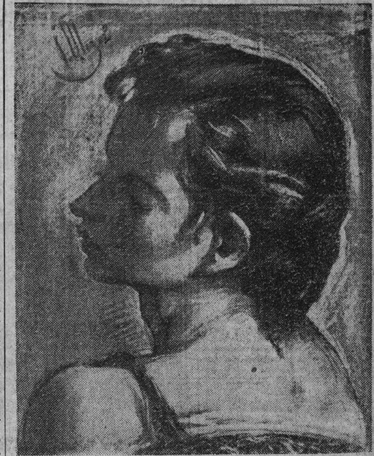
“Dibujo”, por Pedro Mozo