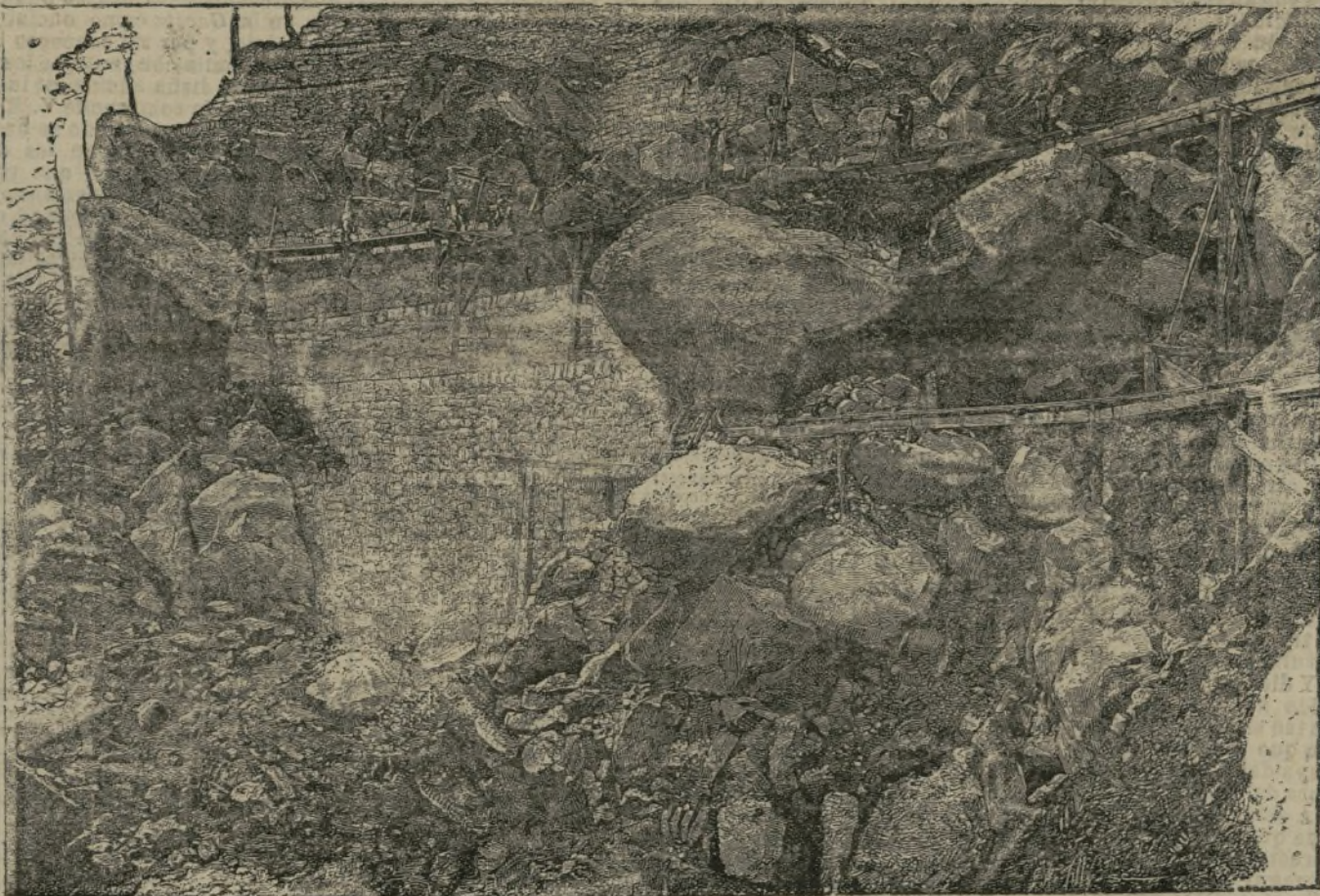
Montaña apuntalada en Cauterets.

Volvíó a pararse y a escuchar. Esta vez oyó unos pasos hacia la entrada de la sala. «Me parece que viene—dijo el compañero. Y ambos se dirigieron en busca del cabo que llegaba. «¡Ourre algo! «Aparte del frío, nada. «¡Vaya, pues no dormirse. Signó el cabo su camino y a pose el ruido de sus pasos se perdió por detrás de la esquina. Un grito desgarrador rompió el silencio de la noche. Signó otro, luego muchos; corrieron Aniceto y su compañero, se abrieron balcones y ventanas; un resplandor vivísimo iluminó la fachada de una casa. ¡Fuego, fuego! En una rica sodería las rojas llamas recorrían estantes y armarios, consumiendo vorazmente los hermeses tejidos. Llegaron las bombas, las autoridades, acudieron varias decenas de curiosos salidos de no se sabe dónde, todo el personal que en tales casos se presenta, y al poco rato el fuego dominado no había producido mas que dos víctimas: la caja del comerciante y la mano derecha de Aniceto. Había entrado hasta el fondo de la tienda para salvar un manojó de billetes y lo sacó, pero mano y billetes salieron medio consumidos por el fuego. «Un diario, a la mañana siguiente, al contar el suceso, decía que el guardia Aniceto López estaba propuesto para un premio por su valerosa decisión y su celo. «Cuando acabes de leerlo—dijo Aniceto al compañero—pónte una faja y unos sellos y manda el papel a D. Dimas Regleta, maestro en Aldabalos. Así verá que empieza a ser grande. JOSE M. POSTA.