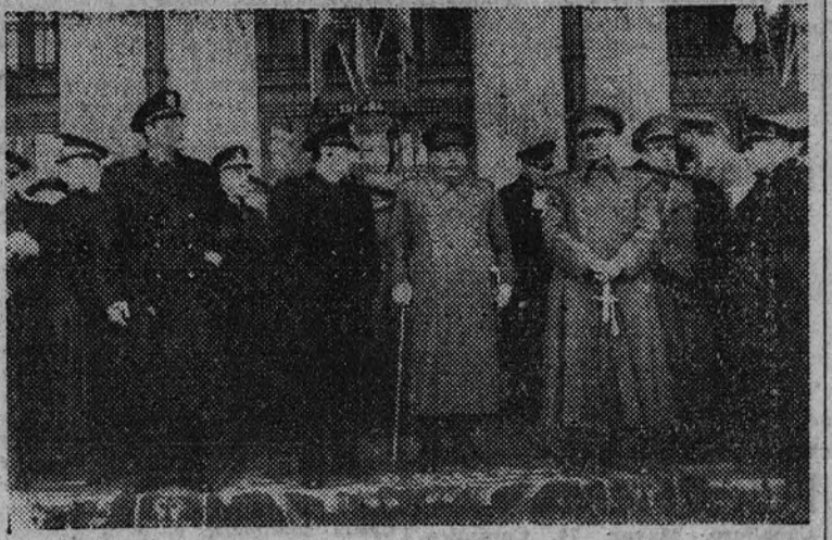
El Gobierno, autoridades, jerarquías y Cuerpo diplomático esperan en la estación el tren en que viene el teniente general Muñoz Grandes

La muchedumbre esperaba el momento de la llegada de las jerarquías y, posteriormente, del tren especial, con el canto casi