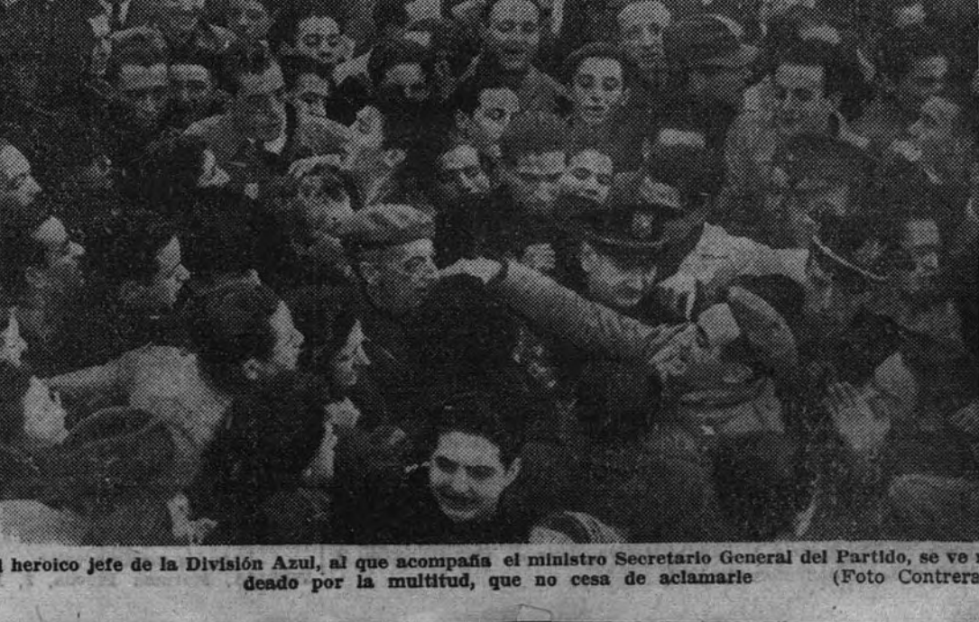
El heroico jefe de la División Azul, al que acompaña el ministro Secretario General del Partido, se ve rodeado por la multitud, que no cesa de aclamarle

En atención a los relevantes méritos contrados por el teniente general don Agustín Muñoz Grandes como jefe de la División Azul en el frente ruso, el Caudillo, Jefe Nacional de la Falange, le ha concedido la Palma de Plata, máxima recompensa falangista al valor que, como es sabido, no se ha otorgado en ninguna ocasión hasta ahora después de la muerte de José Antonio.