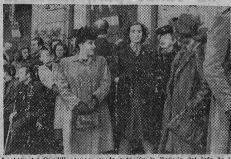
La hija del Caudillo espera en la estación la llegada del jefe de la División Azul.

En primer término, el camarada Arrese saludó al general Asensio y a los demás ministros, siendo objeto de manifestaciones de simpatía entusiásticas por parte de los asistentes.