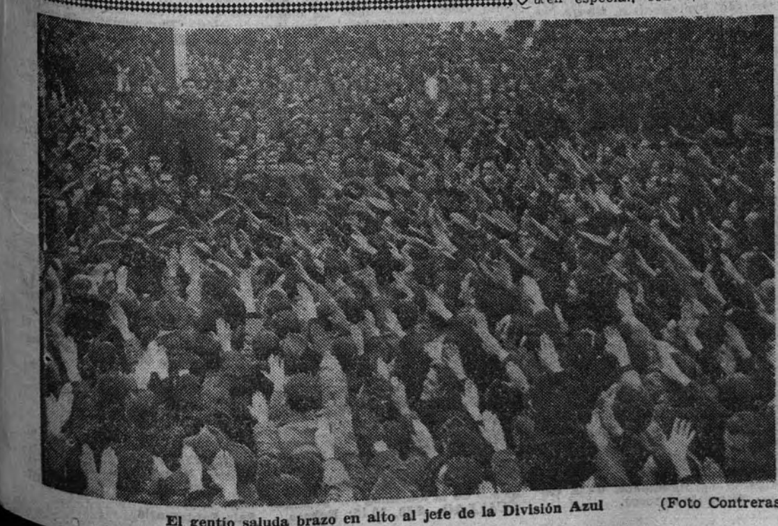
El gentío saluda brazo en alto al jefe de la División Azul

SI ERES FALANGISTA PON EN TUS CARTAS EL SELLO "JOSE ANTONIO"