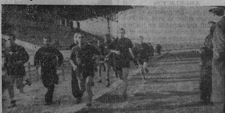
Los jugadores italianos hicieron ayer un poco de entrenamiento en Vallecas

Discreción ante la calidad del equipo visitante Los jugadores estuvieron en El Escorial y fueron recibidos en el Ayuntamiento madrileño