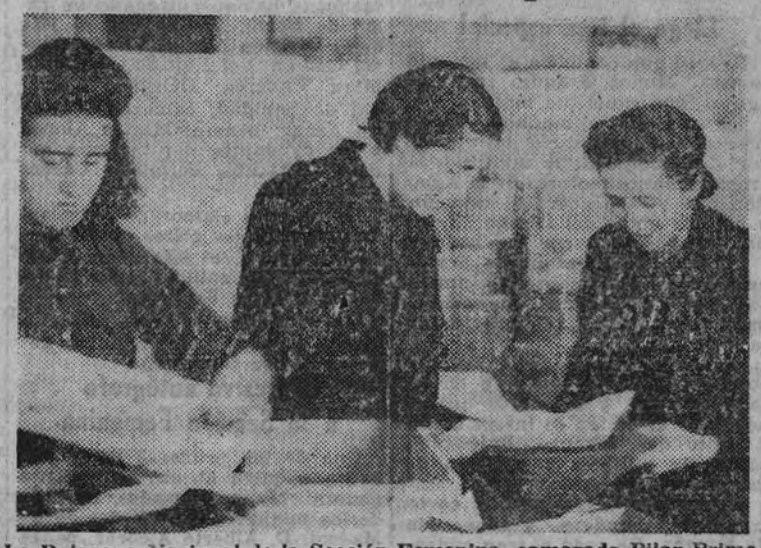
La Delegada Nacional de la Sección Femenina, camarada Pilar Primo de Rivera, examina los envíos

Ya hace año y medio que, entre el fervor apasionado de España entera, marchó al frente de sus voluntarios el general Muñoz Grandes para continuar en Rusia la campaña antibolchevique terminada con éxito en los campos de nuestra Patria. El día de la partida, en un acto homenaje a los voluntarios realizado en la Asociación de la Prensa de Madrid, nuestro general pronunció unas frases concisas y tajantes con todo el valor de una orden del día: «Yo digo, delante de mis soldados, que sabremos cumplir con nuestro deber, y al marchar os hacemos un ruego: que vosotros cumpláis con el vuestro.» No fueron desoladas, ni mucho menos, tales palabras, y este cumplimiento del deber fue llevado a efecto por todas las condiciones favorables en diversos terrenos. Merece especial mención el de la solidaridad, cada vez más intensa, de los que permanecían en España con los que luchaban en las nevadas estepas soviéticas. Fue en todo momento una feliz intérprete de este anhelo, de esta ansia de intercambio que tenían aquellos que tan lejos estaban de sus hogares, la Sección Femenina, que puso su mejor voluntad en la más perfecta consecución de este trabajo. El año pasado culminó esta solidaridad con el «Aguinaldo de la División Azul», recibido por nuestros camaradas del lago Ilmen, como