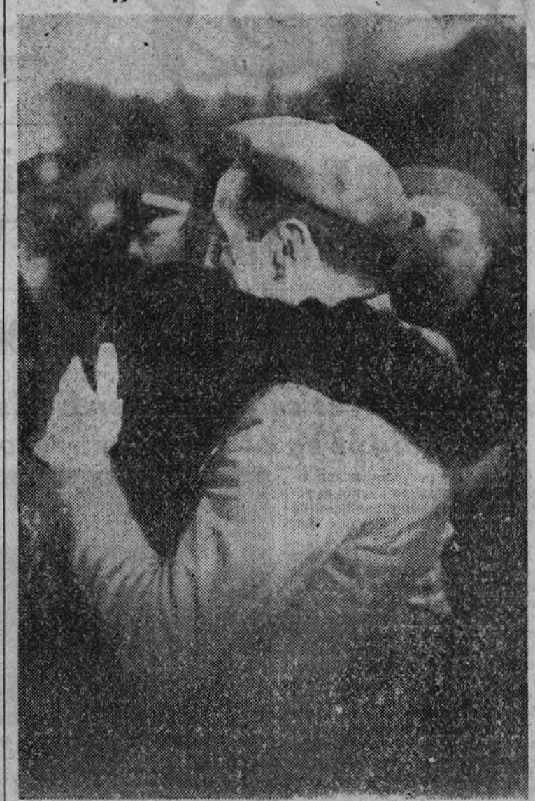
Un voluntario de la División Azul abraza emocionado al heroico jefe en el momento del regreso