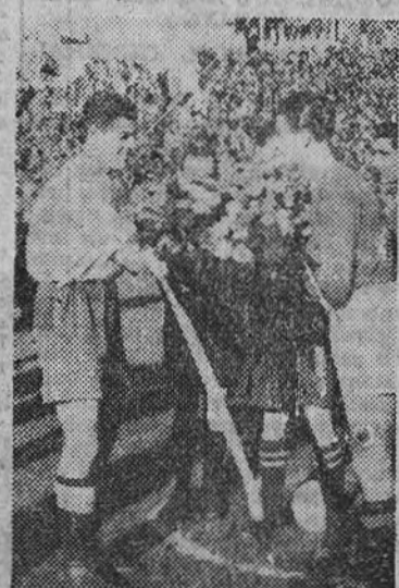
Los capitanes de los dos equipos, en el momento del cambio de regalos

Primer día, plena de esta bella noche, en Vallecas el partido italiano, entre las selecciones de Aviación. Tarde que amaba a estar en las gradas y tribunas. Diez pesetas por una general, gran cantidad de profusión de campo engalanado, embajadores, señores, Relucir de oros y de joyas en la presidencia. Aplausos en las gradas a los dos equipos. Los españoles con los colores tradicionales del Atlético Aviación. Los italianos con los colores tradicionales de la selección. Jersey azul y pantalón blanco. Sonar de músicas, voces, brazos en alto. Saludos, cambios de banderines y regalos. Una gran expectación por ver cómo acababa aquél partido. Ambiente de gran solemnidad, encuentro, sin duda alguna, memorable.