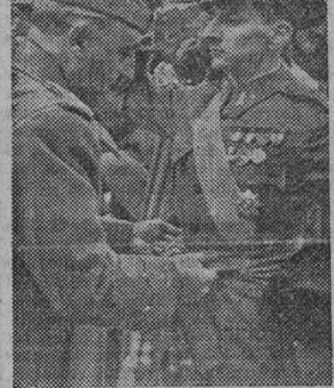
El Caudillo impone el fajín a uno de los oficiales de Estado Mayor

Con el Generalísimo venía en su séquito.