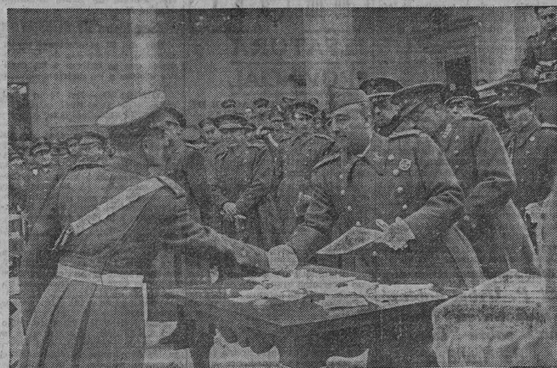
El Caudillo, en el momento de entregar los despachos a los nuevos oficiales