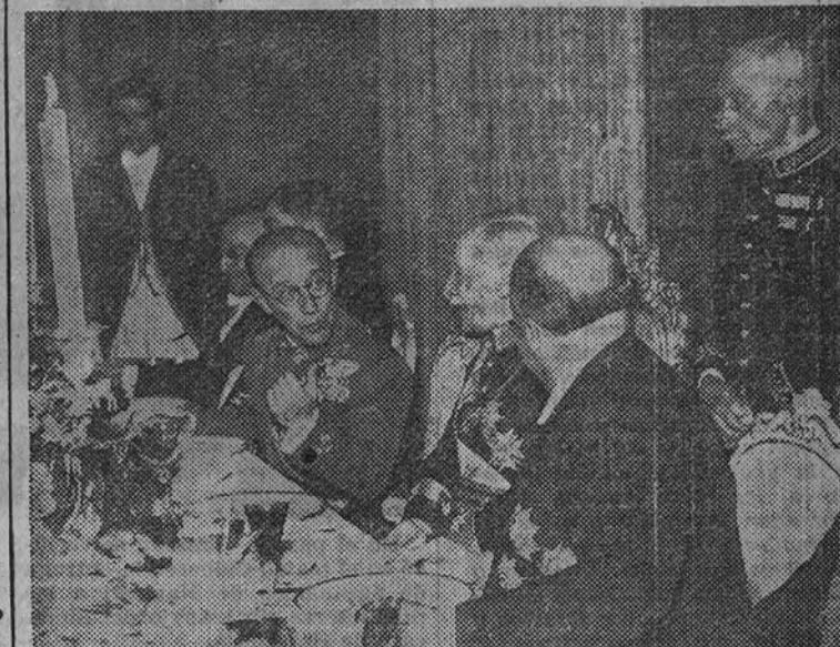
El Presidente de la República portuguesa, general Carmona, almorzando con nuestro ministro de Asuntos Exteriores y el embajador de España en el Palacio de Belem

Hoy, martes, regresa el ministro español de Asuntos Exteriores