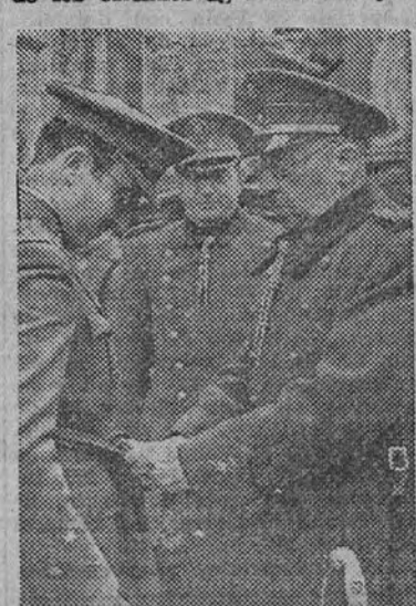
El general Moscardó impone el fajín de Estado Mayor a su hijo