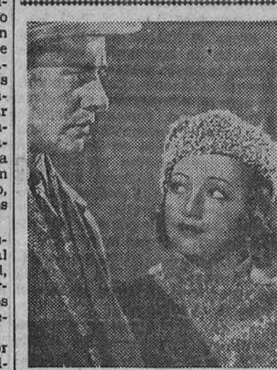
Un fotograma de "Una entre un millón", creación de la "estrella" del deporte y de la pantalla, Sonja Henie.

POESIA Y TECNICA DEL CINE, José Luis Cano escribe sobre este interesante tema en EL ESPAÑOL del 19 de diciembre