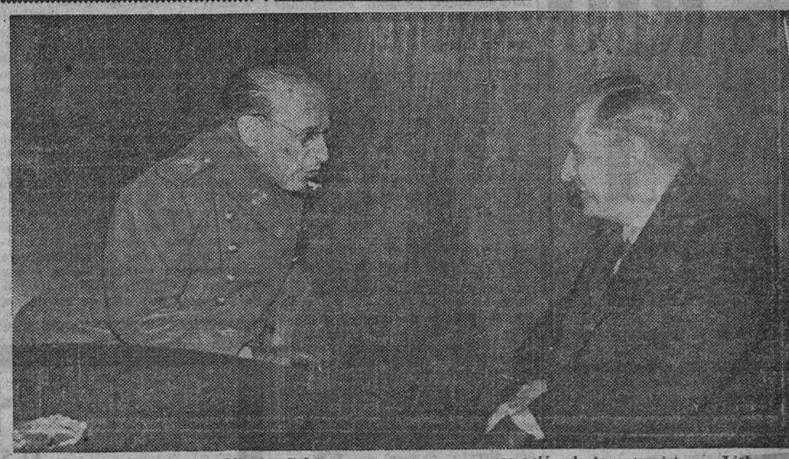
El general Jordana y Oliveira Salazar en su primera conversación de la entrevista en Lisboa