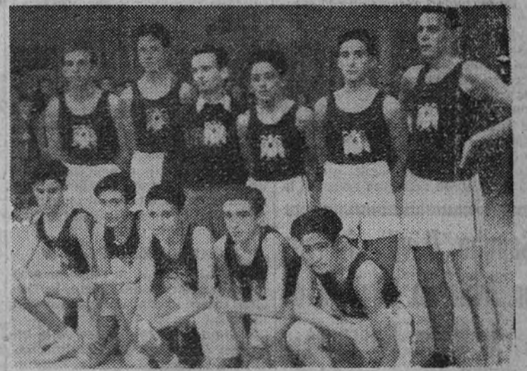
El equipo del Imperial Chamberi, con sus reservas que a lo largo ganó al Liceo Francés en la final del "Trofeo ARRIBA" para cadetes

En dicho período de tiempo se han entregado 196 títulos de la clase A, 156 de la clase B y 156 de la clase C. (Mencheta).