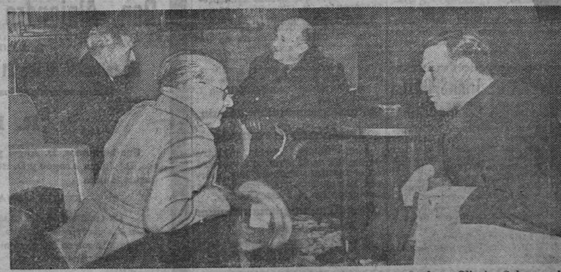
En el barco, durante la travesía del Tago, entrando en Lisboa, El general Jordana, Oliveira Salazar y los embajadores de los dos países departan amistosamente