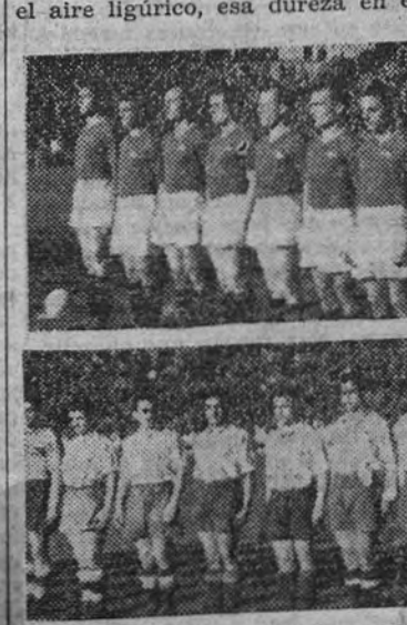
Los equipos de la Aviación de Italia y del Atlético Aviación formados ante la tribuna presidencial momentos antes de comenzar el encuentro