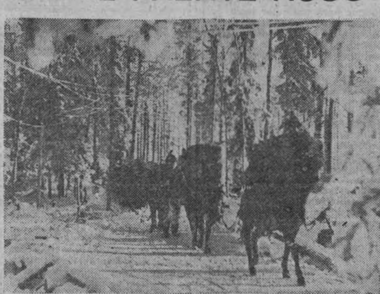
Sobre la nieve rusa, las columnas de abastecimiento acuden a los puestos del frente.