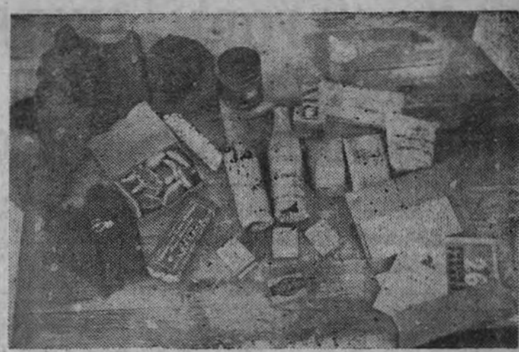
Cada voluntario de la División Azul recibirá en su agutinal una foto como el de la fotografía

LONDRES 21.—«En la noche última, del domingo al lunes, un gran contingente de nuestros bombarderos atacó los objetivos industriales de Duisburgo, con tiempo favorable y claro. El ataque fué intenso y concentrado, y numerosos incendios se declararon cuando nuestros aparatos iniciaron su regreso.