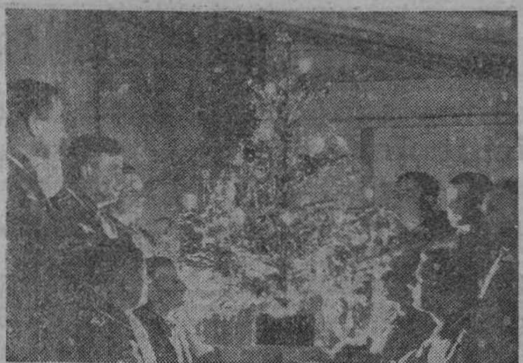
Los soldados alemanes preparan el tradicional Arbol de Noel