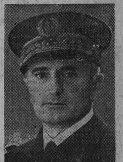
El almirante Darlan

LONDRES 25.—Se afirma en los centros londinenses que el general De Gaulle se desplazará en breve a los Estados Unidos. (Efe.)