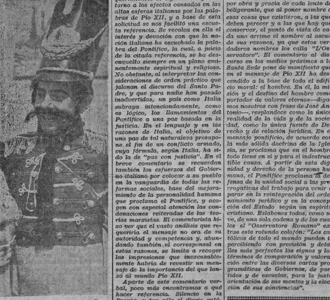
La reconstrucción que las autoridades de ocupación alemanas realizan en el Este no es sólo de tipo material. En Smolensk se han vuelto a abrir algunos teatros, en los que compañías recién formadas representan piezas históricas.