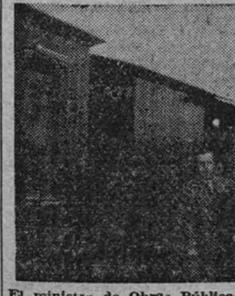
El ministro de Obras Públicas, señor Peña Bouff, en la ceremonia de bendición del primer convoy del nuevo ferrocarril Fuenferraz-Colmenar Viejo

El ministro de Obras Públicas, señor Peña, inauguró ayer, a las cinco de la tarde, la línea del ferrocarril de vía estrecha, trayecto de Madrid a Colmenar Viejo, con punto de enlace en el inmediato pueblo de Fuenferraz. La Jefatura de Explotación de Ferrocarriles por el Estado se hizo cargo de las instalaciones de esta vía férrea, que durante la guerra destruyó no sólo en las vías, sino en las estaciones y demás servicios. Hechas las reparaciones necesarias, se pone de nuevo en funcionamiento el trayecto desde Fuenferraz a Colmenar Viejo. Al acto de inauguración asistieron con el ministro el subsecretario del departamento, señor Granados, el director general de Ferrocarriles, don Pedro Benito Barrera, y personal técnico, así como los alcaldes y autoridades de Fuenferraz y Colmenar. Las estaciones estaban engalanadas, y en ellas el vecindario acudió en masa a presenciar el paso del tren oficial, que fué recibido con vitores. Esta pequeña línea presta- rá un valiosísimo servicio a los pueblos de Fuenferraz y Colmenar, que tienen de esta manera segura su comunicación con la capital.